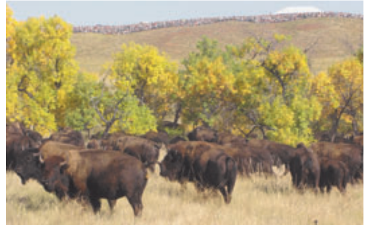
Bizonen zijn niet agressief, maar je moet ze niet beginnen stangen.

dige landschap is een echte aanrader. Alle wandelingen zijn goed bewegwijzerd, maar je kan ook een gids meevragen. In het park kan je trouwens ook een begeleide wildsafari doen met een jeep of een heuse tocht per paard. Net buiten het park is ook een machtige grot, de Rushmore Cave, te bezichtigen. (maf)