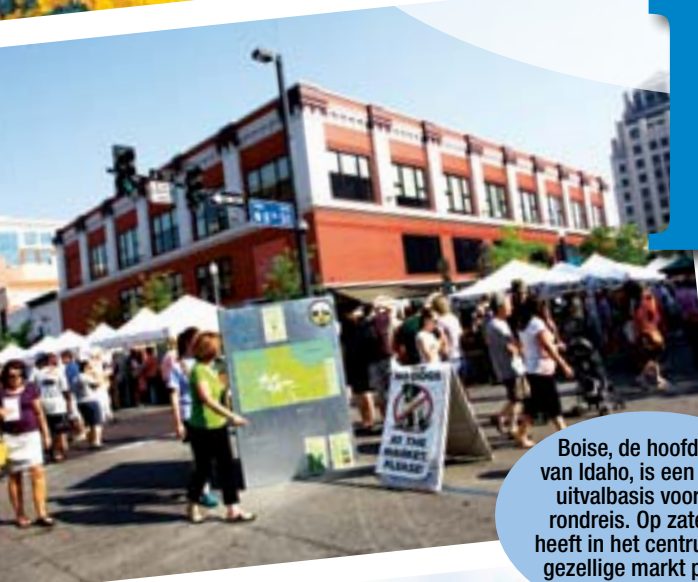
Boise, de hoofdstad van Idaho, is een ideale uitvalbasis voor een rondreis. Op zaterdag heeft in het centrum een gezellige markt plaats.