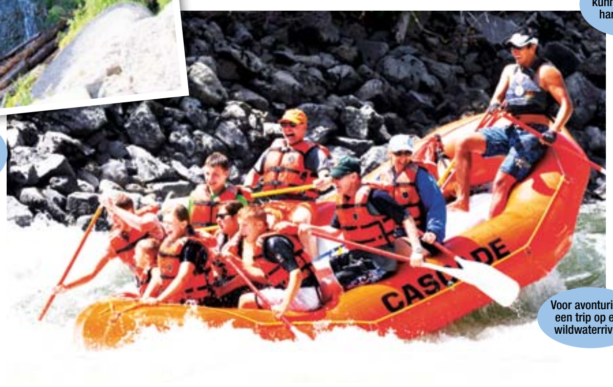
Voor avonturiers: een trip op een wildwater rivier.