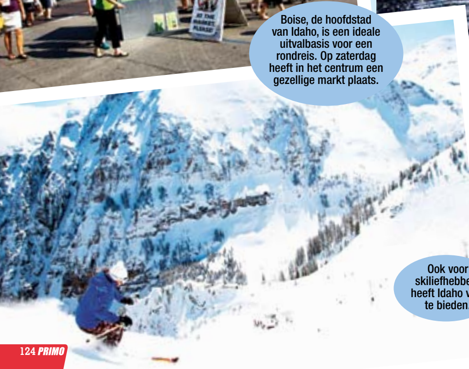
Ook voor skiliefhebbers heeft Idaho veel te bieden.