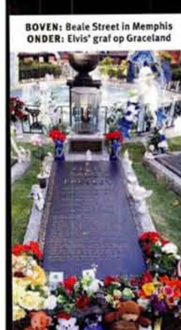
BOVEN: Beale Street in Memphis ONDER: Elvis' graf op Graceland