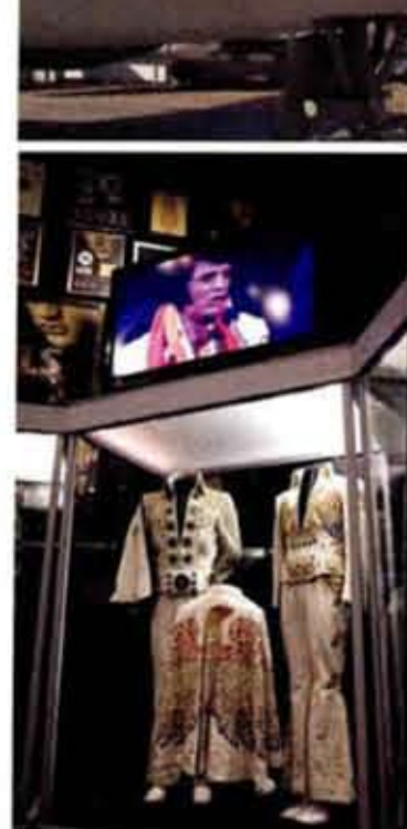
BOVEN: Herinneringen aan Elvis. ONDER: Graceland.