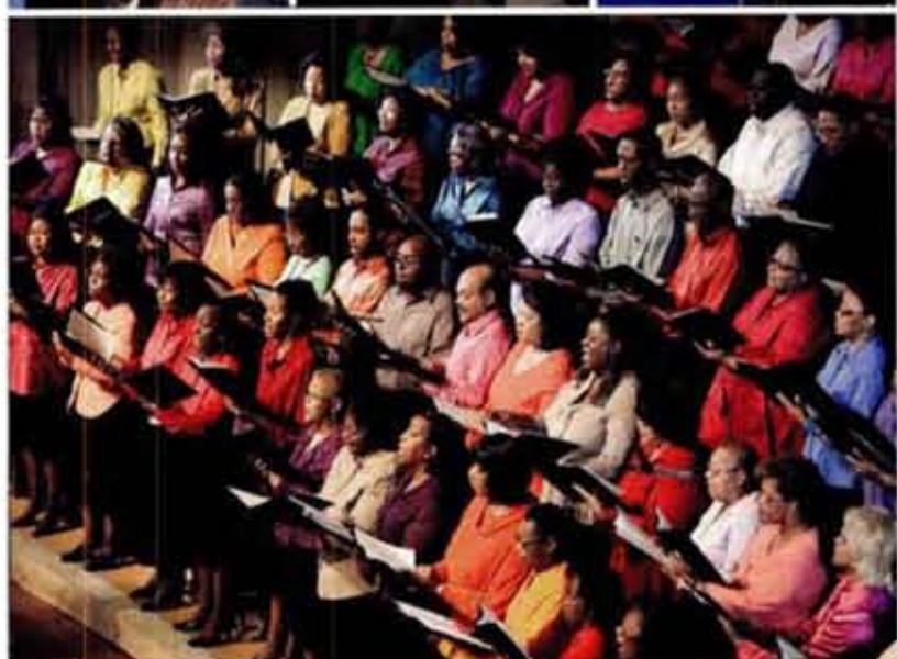
BOVEN Links: Legendarische Sun Studio Midden: National Civil Rights Museum. MIDDEN: Mississippi Boulevard Christian Church.