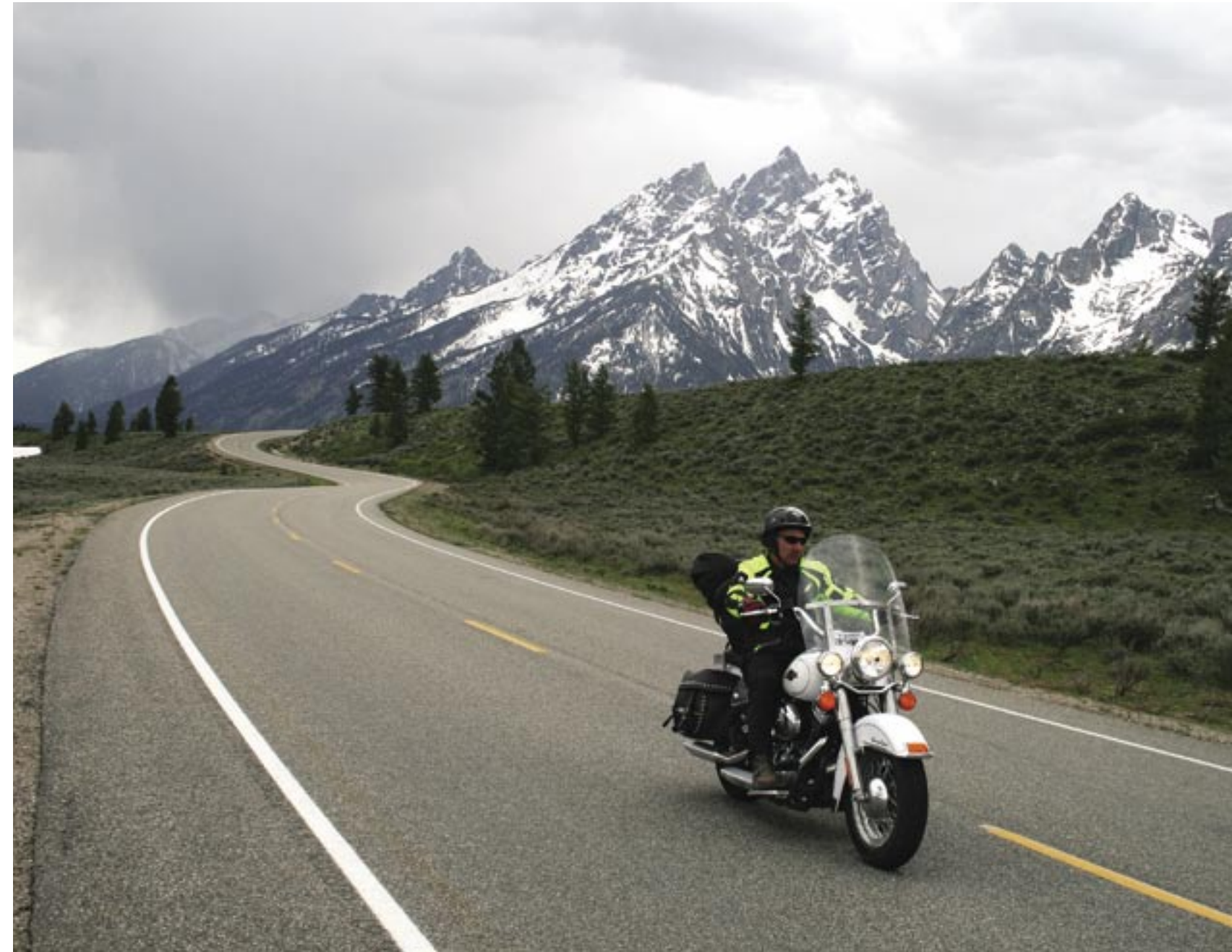
HET ONHEILPELLENDE WEER ZET DE WOESTHEID VAN DE GRAND TETONS NOG EXTRA IN DE VERF.

Het stadje bruist van het leven, iedereen wil er zijn en eigenlijk is het niet meer dan een handig opgezette toeristenval. We trappen er bewust in, gewoon om eens even rond te neuzen. Een karwei is dat niet, want de omgeving is prachtig, maar de kitscherige winkeltjes duwen ons vroeger in het zadel dan gepland. Op weg naar het zuidoosten verandert het landschap abrupt. De bergen worden heuvels, de vegetatie wordt ruiger en alleen kniehoge struiken fungeren hier nog als armtierige bodembedekker. We rijden over een strak gespannen asfaltlint dat dwars door dit onherbergzaam land voert. Niemand te bespeuren, maar dat zijn we ondertussen al gewoon. Een toeristisch bord trekt onze aandacht en langs een stoffige