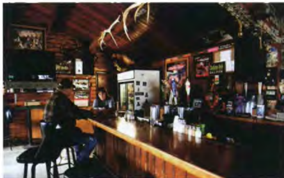
Lewis en Clark troffen duizenden elanden op hun tocht. En ook nu nog lopen de beesten over de vlakten. En ze prijken aan de muren.