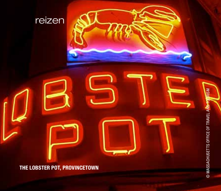
THE LOBSTER POT, PROVINCETOWN