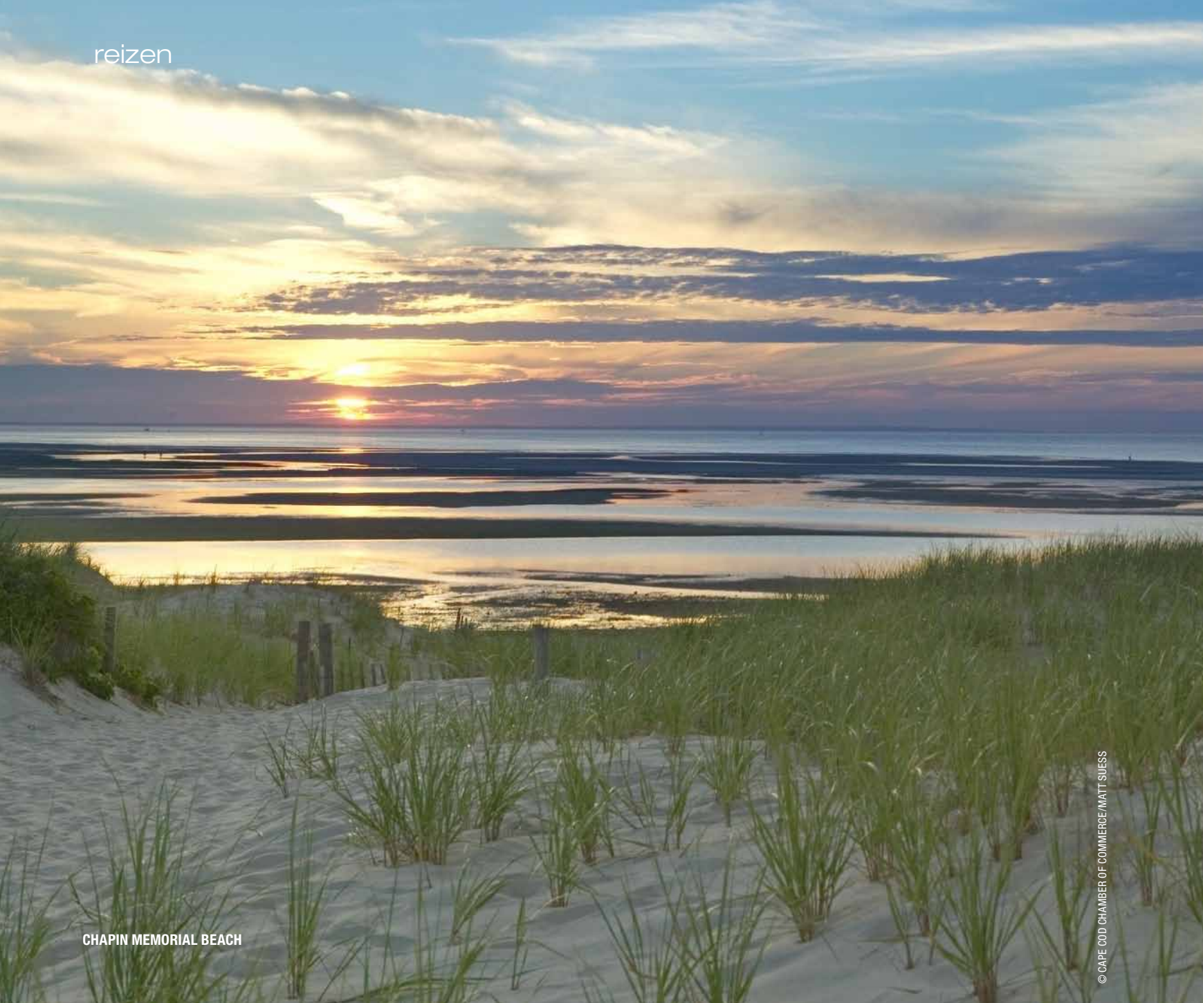
CHAPIN MEMORIAL BEACH