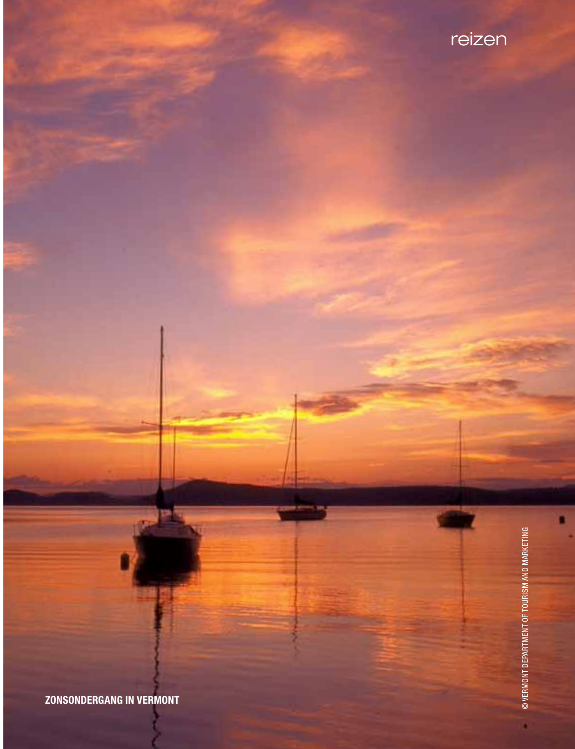
ZONSONDERGANG IN VERMONT