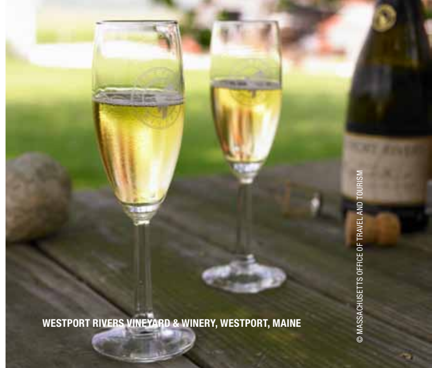
WESTPORT RIVERS VINEYARD &amp; WINERY, WESTPORT, MAINE