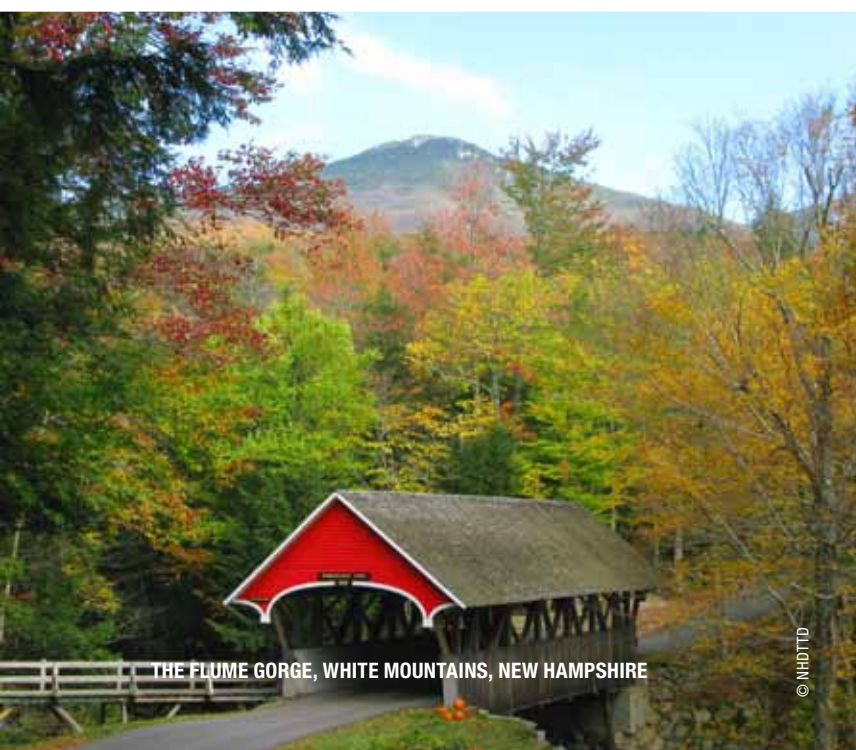
THE FLUME GORGE, WHITE MOUNTAINS, NEW HAMPSHIRE