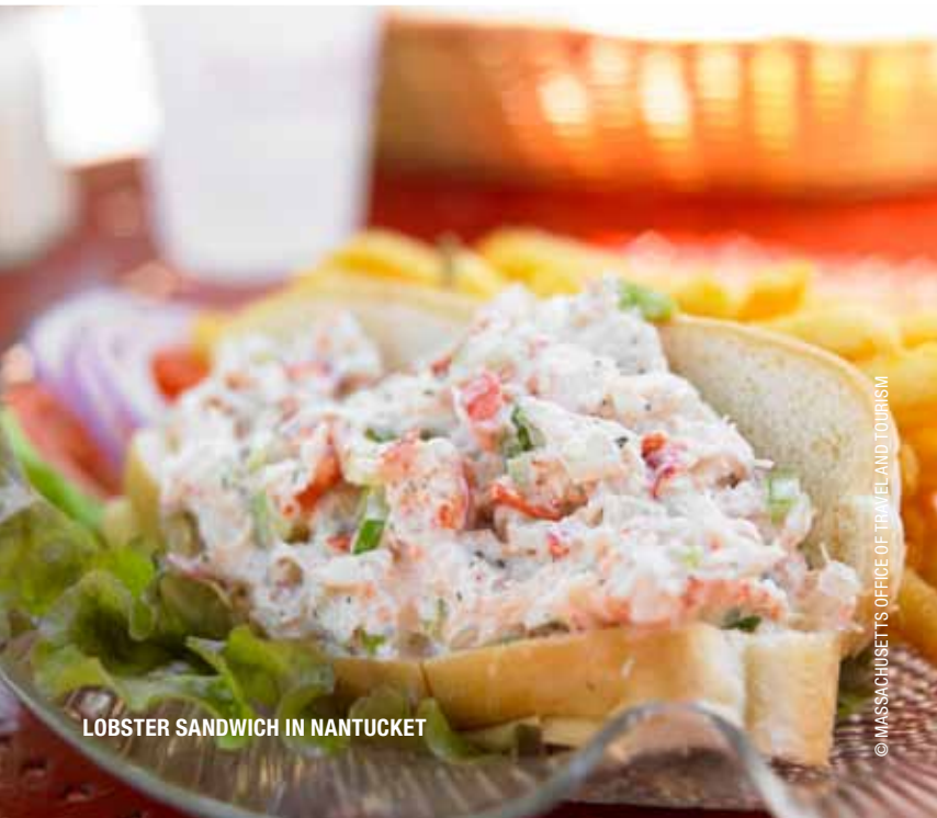
LOBSTER SANDWICH IN NANTUCKET