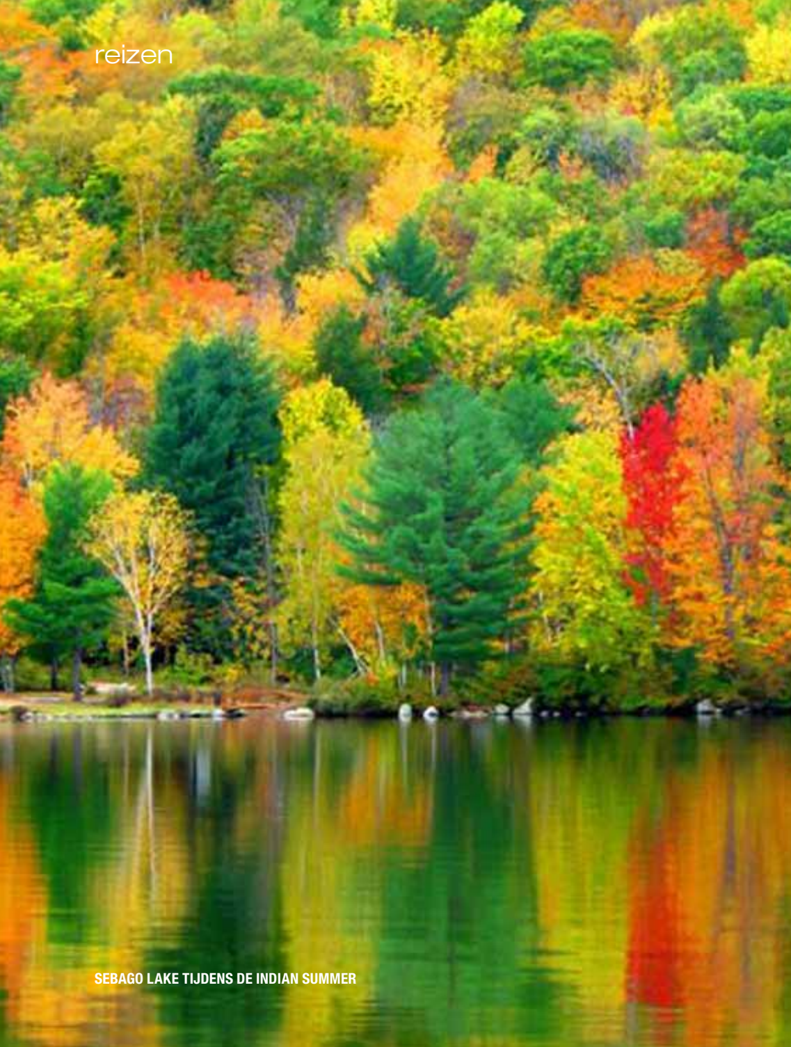
SEBAGO LAKE TIJDENS DE INDIAN SUMMER