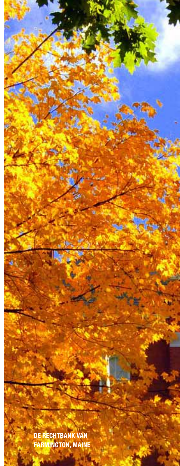
DE RECHTBANK VAN FARMINGTON, MAINE

Vanaf Boston Logan International Airport is het heel eenvoudig om met het openbaar vervoer, de 'T', het centrum van Boston te bereiken. De stad zelf is prima te voet te verkennen. Sterker nog, je volgt simpelweg een dikke rode streep die op de stoep is geverfd. Deze vier kilometer lange Freedom Trail voert langs diverse locaties die een belangrijke rol in de geschiedenis hebben gespeeld. Een plattegrond met extra informatie is verkrijgbaar in het Visitor Information Center in Tremont Street aan de oostkant van Common Park en daar begint de route. Ook roodgekleurd is het tenue van de beroemde Boston Red Sox die op Fenway Park spelen. Als je in de gelegenheid bent is het zeker de moeite waard een wedstrijd te bezoeken, of anders op zijn minst een rondleiding door het indrukwekkende honkbalstadion te boeken. Maar na deze zijstap, terug naar de 'rode' route. Steek de Charles River over naar Cambridge en neem een kijkje op de campus van de beroemde Harvard Universiteit waar de schoolkleur, niet geheel onverwacht, rood is. 's Avonds