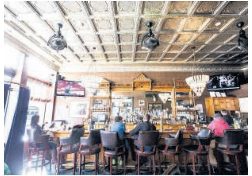
Schrijver Hunter S. Thompson was elke dag in de J-Bar in Aspen te vinden.