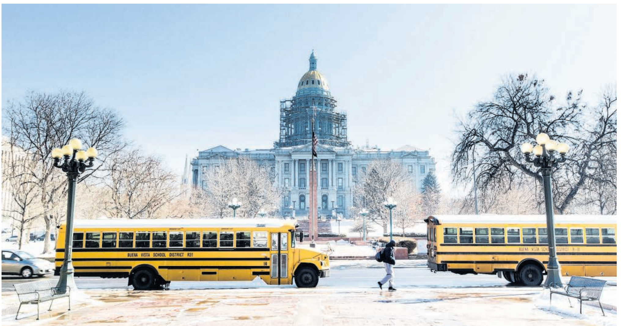
De stad Denver heeft een ontspannende uitwerking: vrijwel iedereen is vriendelijk, enthousiast en opgewekt.