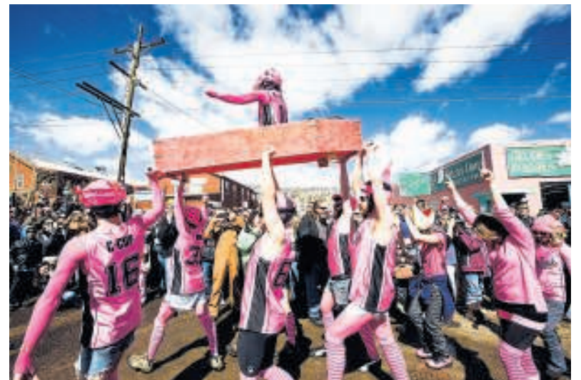
Bij het festival Frozen Dead Guy Days in het dorp Nederland draait alles om de dood.