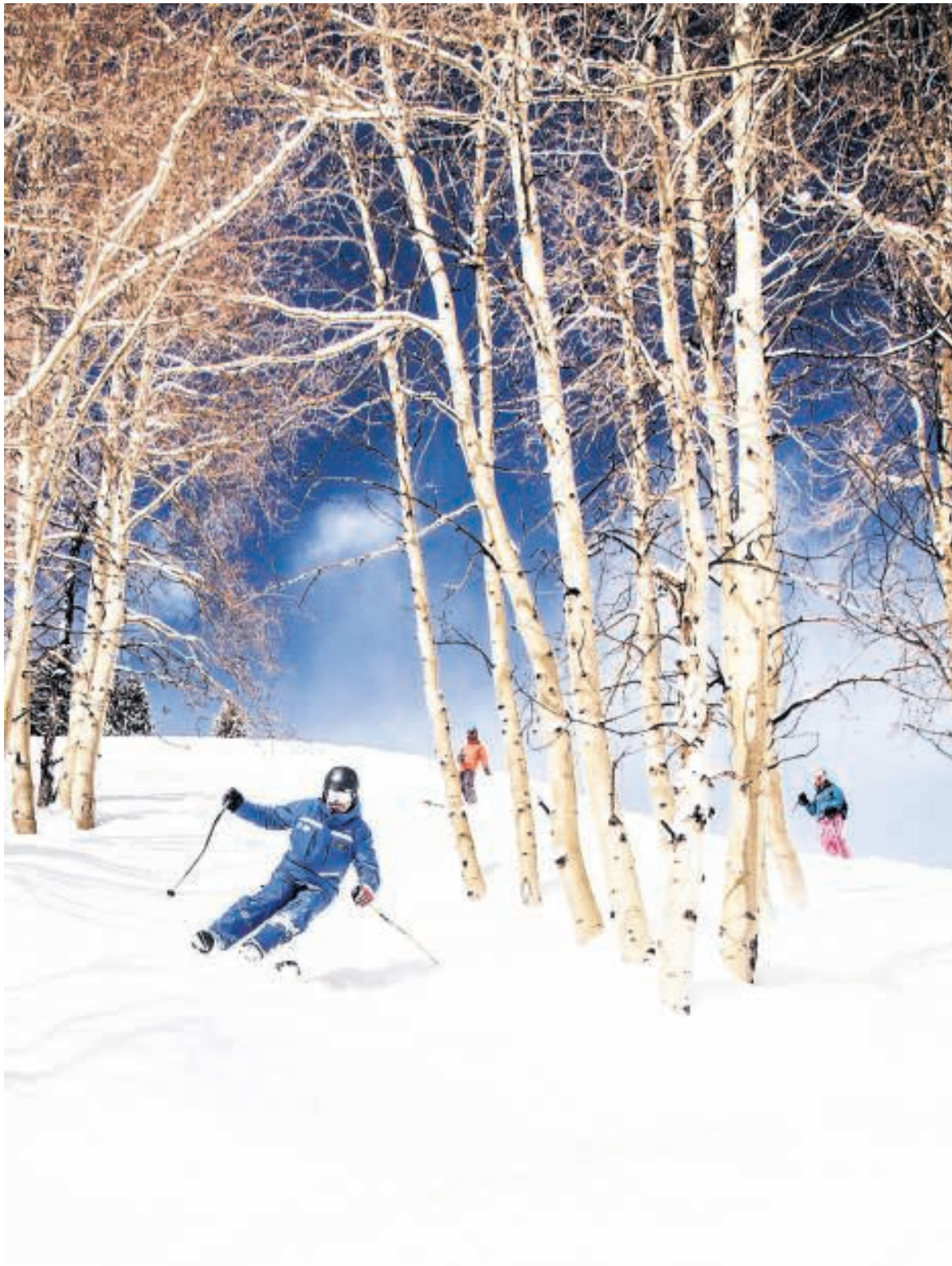
Vail en Breckenridge behoren tot de beste skigebieden van de Verenigde Staten.