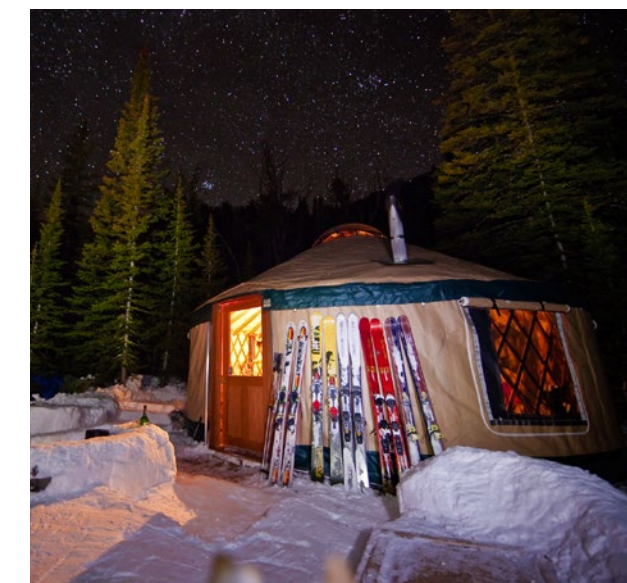
Slapen in een originele joert is een aparte beleving

inspannend, maar wel zo smaakvol. En na het culinaire avontuur is een overnachting in een van de spookstadjes een mooie afsluiting van een winterse dag. De enige vraag die nog overeind blijft staan: durf je het aan om te slapen tussen de spaken?