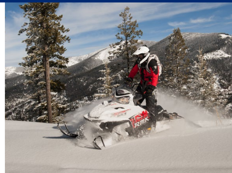
Als je van snelheid houdt, dan mag een sneeuwscootertocht niet ontbreken

en met de familie wil doen, zijn er verschillende mogelijkheden. Het hoogtepunt van een winters avontuur in Montana is voor de meeste mensen een hondensledetocht. Na een uitgebreide briefing neem je plaats op de slede, de een gezeten op de slee en de ander staand achterop, om te sturen en vooral te remmen. De gidsen waar schuwen er al voor: zodra de rem losgaat schiet je als een raket weg. Je moet dan ook constant remmen om niet uit de bocht te vliegen. De route is fenomenaal: door bossen en over bevroren meren en rivieren. En ook heerlijk: door de energie die ze verbruiken hebben de honden nauwelijks meer puf om te blaffen en cruise je bijna in absolute stilte door het landschap. Er zijn verschillende locaties om met de hondenslede op pad te gaan, zoals Base Camp Bigfork of Yellowstone Dog Sled Adventures in Big Sky. Een ander avontuur is meer voor de inwendige mens: een bizonburger pakken in een van de vele restaurants, zoals Hop's Downtown Grill in Kalispell of Joe's Pasty Shop in Butte. Minder