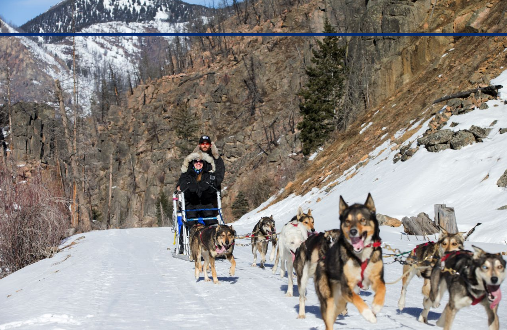
Het hoogtepunt voor velen zal de tocht met de hondenslede zijn