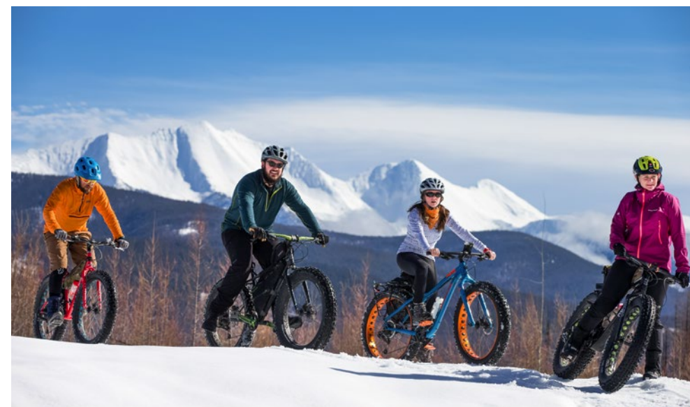
Fat-tire biking is zeker in de wintermaanden ideaal