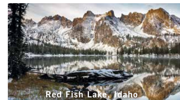
Red Fish Lake, Idaho