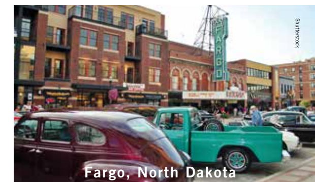
Fargo, North Dakota