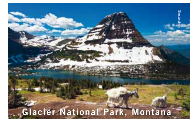
Glacier National Park, Montana