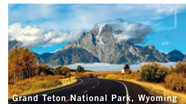
Grand Teton National Park, Wyoming