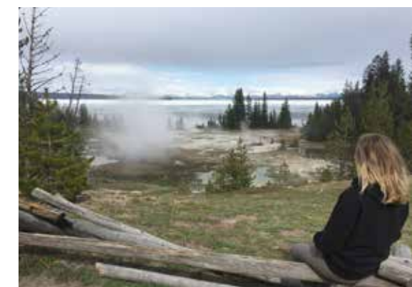
Heetwaterpoelen bij West Thumb