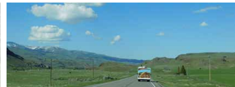
Op weg naar Big Timber, Montana