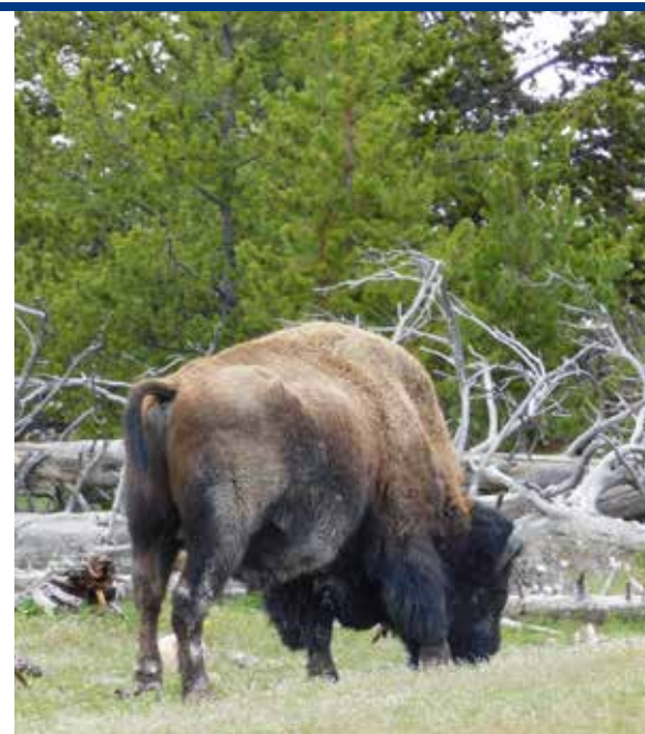
De eerste bizon die gespot wordt

Een nieuwe dag breekt aan in Yellowstone, en wat een dag. De zon schijnt volop en aangezien we hoog in de bergen zitten, smeren we ons meteen goed in. Vandaag hebben we een Yellow Bus Tour geboekt. Klokslag acht uur neemt de Ranger ons mee op pad. Omdat het nog vroeg is, zien we al snel onze eerste bizon langs de weg struinen. Van onze eerste bizons worden wel dertig foto's gemaakt, nog niet beseffende dat er die dag nog tientallen zullen volgen. De eerste bezienswaardigheid van de dag zijn de Lower en Upper Falls. Bij Artist Point hebben we uitzicht over de canyon met in de verte de beroemde waterval. Als kers op de taart verschijnt er een regenboog als er een foto wordt genomen. We rijden door naar Norris Geysir Basin en het