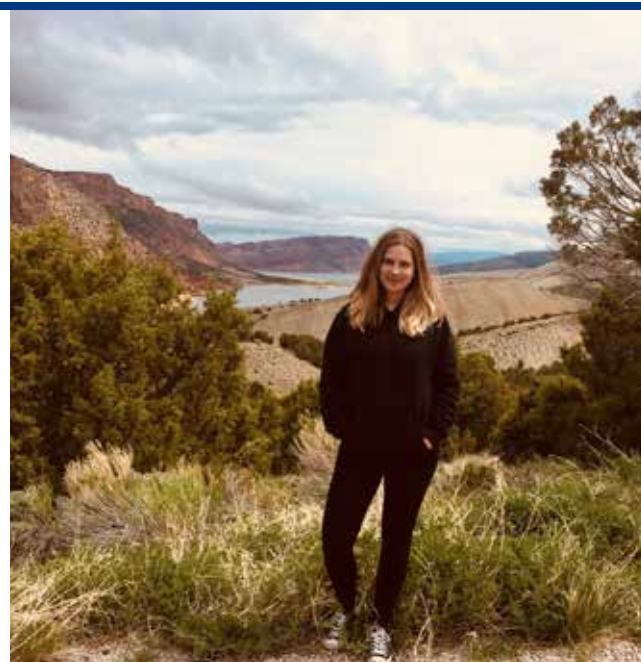
Uitzicht over de Red Canyon in Flaming Gorge

Onze eerste stop is Rock Springs in Wyoming. In dit mijnstadje overnachten we op de KOA-camping en nemen we de tijd om onze spullen uit te pakken en boodschappen te doen bij Walmart. Door de jetlag zijn we de volgende ochtend mooi op tijd uit de veren en rijden we naar de Flaming Gorge op de grens van Wyoming en Utah. We hebben de tijd, dus we besluiten om de hele loop te rijden rondom het Flaming Gorge Lake, met als hoogtepunt een prachtig uitzicht over de Red Canyon. De tocht duurt ongeveer vijf uur, maar het is erg rustig op de weg en we lunchen uitgebreid in onze camper bij het Flaming Gorge Dam Visitor Center. In de middag rijden we door naar het stadje Jackson, waar we overnachten op het Virginian RV Park. Hier staan we voor het eerst tussen de enorme RV's van de Amerikanen en voelen we ons plots een kleintje met negen meter. 's Avonds eten we een burger bij een American Football Bar dichtbij het RV Park en pakken we een goede nachtrust. De volgende dag beginnen we immers aan de route waar we voor gekomen zijn: dwars door Grand Teton National Park naar Yellowstone.