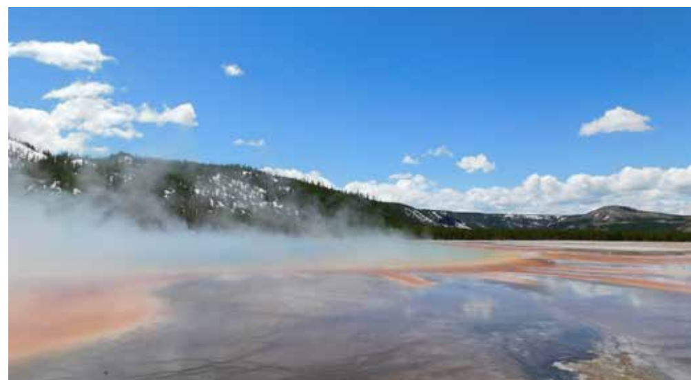
De Grand Prismatic Spring

Vanuit Jackson zien we al heel snel de herkenbare Grand Teton-bergtoppen opduiken. Met het indrukwekkende gebergte aan onze linkerkant rijden we door het park en maken we pitstops bij Moose en Jenny Lake. Tegen het middaguur zien we het beroemde entreebord van Yellowstone en besluiten om hier te parkeren en de campingstoeltjes uit te klappen voor een picknick in het warme winterzonnetje. En zo rijden we via de South Entrance het oudste nationale park van Amerika binnen. Onderweg naar Fishing Bridge, waar we overnachten op het RV Park, zetten we nog verschillende keren de camper langs de kant van de weg om foto's te maken van het prachtige uitzicht over West Thumb. Bij aankomst op de campground waarschuwen de vriendelijke Rangers ons voor de beren. Geen kampvuurtjes maken en al je vuilnis meteen weggooiden in de speciale