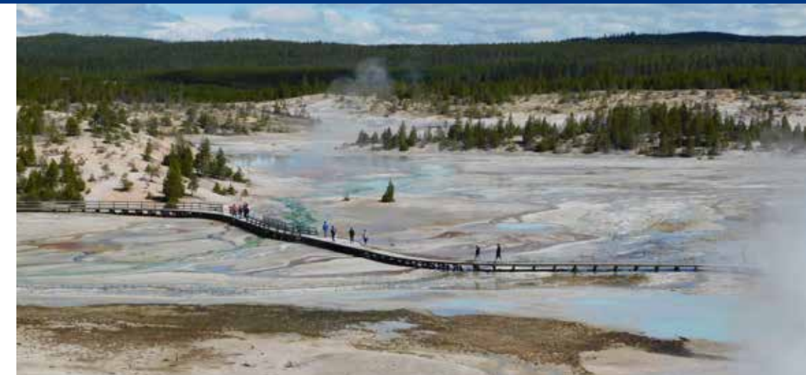
Norris Geyser Basin

Terug in Jackson spenderen we hier nog een laatste dag. Vroeg in de ochtend melden we ons bij Mad River Boat Trips, waar we samen met een gids een twee uur durende boottocht maken over de Snake River. Vanuit Jackson rijden we richting Salt Lake City, waar we onze camper weer inleveren bij de verhuurlocatie en met een transfer van Cruise America naar het vliegveld worden gebracht. 2.600 kilometer op de teller, twaalfhonderd foto's op onze camera, vijf ingangen van Yellowstone, drie beren en twee gelukkige mensen lijkt me een mooie opsomming van deze prachtige reis.