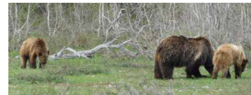
De grizzly met haar welpjes in Grand Teton National Park