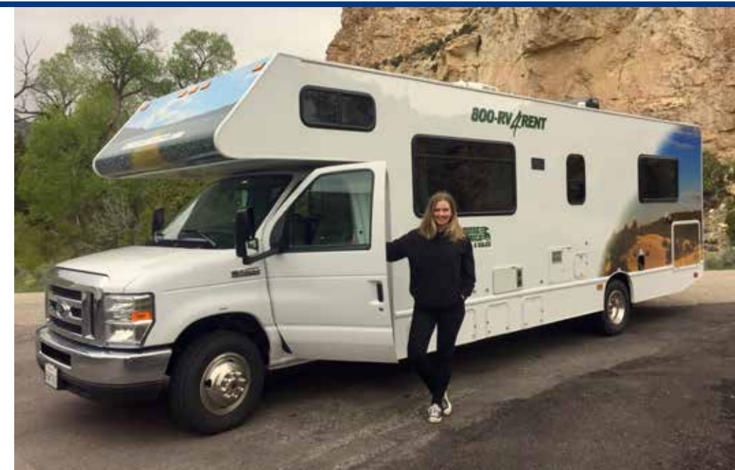
Poserend voor de C30-camper van Cruise America

Omdat de omgeving zo mooi is, besluiten we de volgende ochtend om de Chief Joseph Scenic Byway te rijden richting onze eindbestemming van de dag: Red Lodge in Montana. Na twee uur rijden stuiten we op een roadblock