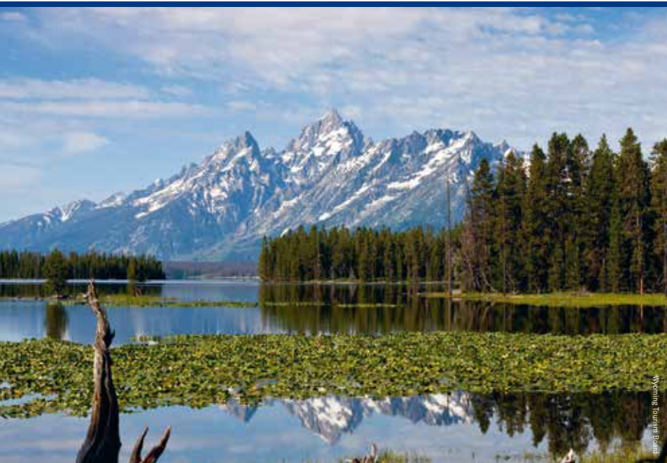
De herkenbare Grand Teton-bergtoppen

Onze reis start in Salt Lake City, Utah, waar we onze Cruise America-camper ophalen. Na een introductiefilm en een check in en rondom de camper, mogen we de type C30-camper van maar liefst negen meter besturen. In beginsel voelt het nog wat onwennig, maar de automatische bediening en de brede Amerikaanse wegen maken het al snel gemakkelijk. Daarnaast zien de locals al aan het bekende exterieur van de Cruise America-campers dat ze te maken hebben met toeristen, dus men geeft je vaak de ruimte.