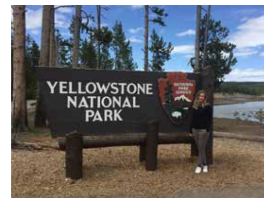
Het entreebord van Yellowstone