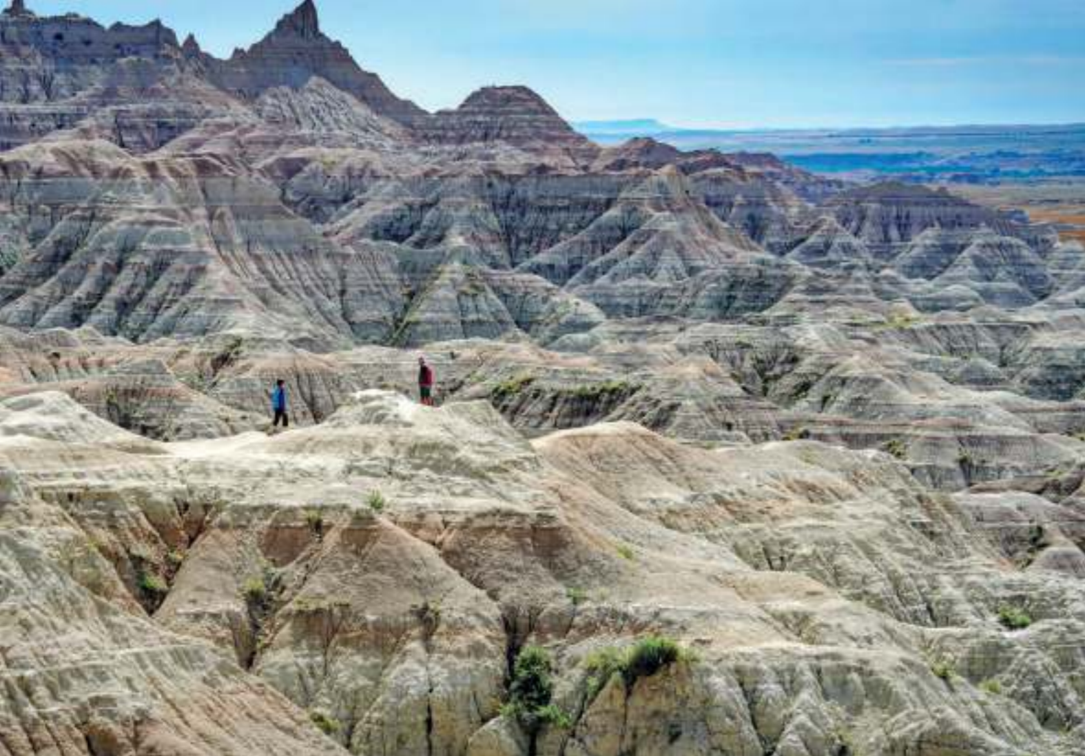
Openingsfoto Redfish Lake in Idaho Rechterpagina Mount Rushmore

Onze Amerikaanse ontdekkingsreis begint in Minneapolis, bekend van de grootste shopping mall in de VS (en dat zegt wat). We brengen uiteraard een bezoek aan deze Mall of America, waar zelfs een enorme indoor achtbaan doorheen racet. Na twee dagen citytrips in Minneapolis halen we onze huurcamper op bij de verhuurlocatie van Cruise America. Hier kijken we de introductiefilm over de camper en lopen we samen met een medewerker alle functionaliteiten in en rondom de camper na. We huren het grootste type van Cruise America, de C30 van ruim negen meter lang. Op het eerste gezicht even schrikken, maar door de automatische bediening en de brede Amerikaanse wegen zijn we snel gewend aan ons nieuwe onderkomen voor de komende weken.