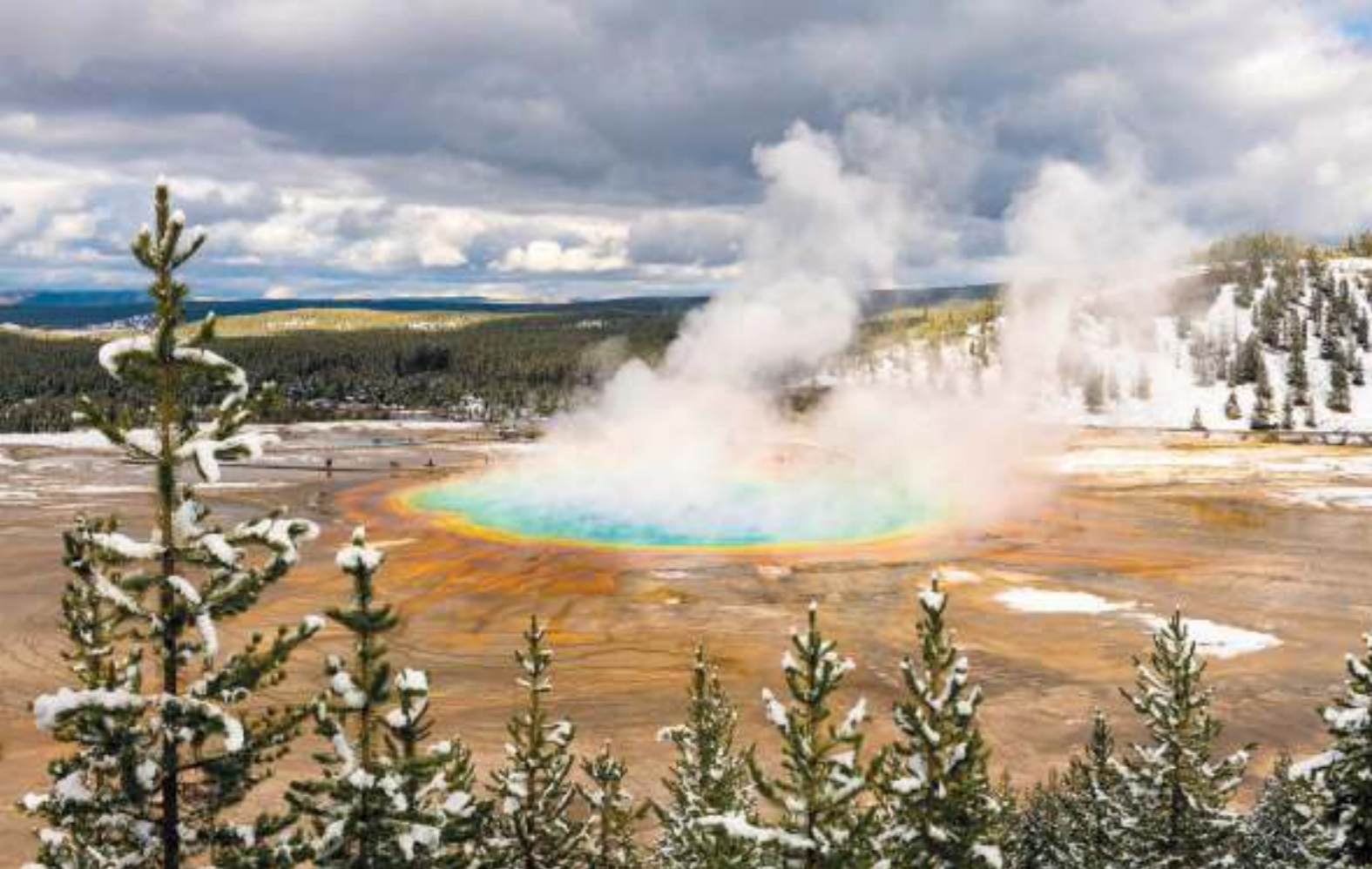
Boven Yellowstone National Park Rechterpagina Devils Tower

We sluiten de dag af in Cosmos, waar het lijkt alsof de wetten van de natuur je in de maling nemen en de zwaartekracht veranderd. Hoe, dat moet je zelf onder vinden.