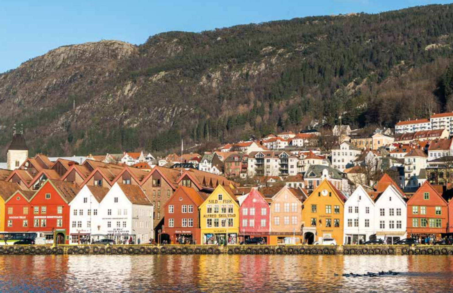
Boven Het schitterende Bergen Rechterpagina vanaf boven met de klok mee De omgeving van Dorvefjell; Preikestolen; Uitzicht over Dalsnibba