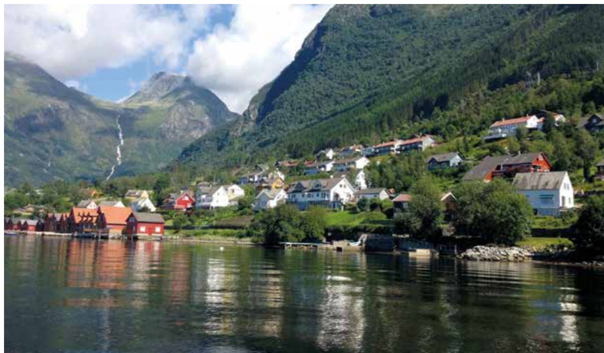
Boven De Sognefjord Rechterpagina Preikestolen

Aansluitend rijd je richting het zuiden naar de langste en diepste fjord van Noorwegen: de Sognefjord. Deze iconische bestemming is maar liefst 204 kilometer lang en biedt onderweg tal van vertakkingen, gletsjers en kleine pittoreske dorpjes. Een paar mooie vertakkingen van de fjord zijn de Nærøyfjord en Lustrafjord, die ook te bewonderen zijn per boottocht. Je vindt hier tevens de grootste gletsjer van Europa in Nationaal Park Jostedalbreen. Ook deze regio staat op de duurzame bestemmingenlijst van Noorwegen. Avonturiers kunnen hier een wandeling maken onder begeleiding van een gids.