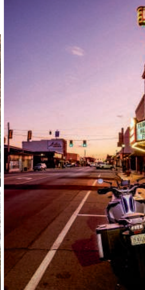
Slingerend door het landschap Alabama overdondert niet, maar is het Amerika van de gewone man.

geluid dat als funky R&B werd omschreven.