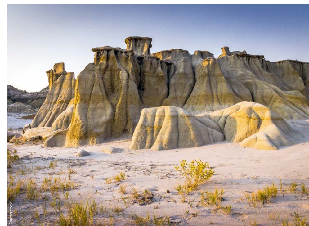
Hoodoos in Theodore Roosevelt National Park