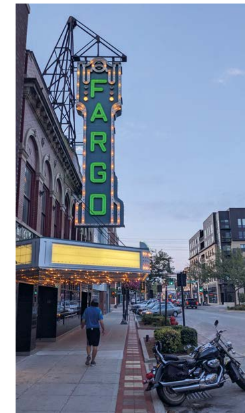
Het filmtheater van Fargo is na zonsondergang nog mooier