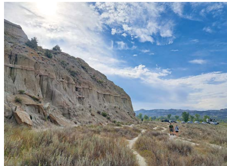
In Theodore Roosevelt National Park tref je prachtige rotsformaties aan, zoals hier in de North Unit

We laten de speelhallen, olievelden en hoofdwegen links liggen voor een bezoek aan het MHA Nation Interpretive Center. De afkorting staat voor Mandan, Hidatsa en Arikara, ook wel Three Affiliated Tribes genoemd. De drie aaneengesloten stammen leven van oudsher aan de Missouri River in de staten Montana, Wyoming en het noordwesten van North Dakota. Trotse volkeren die in New Town een eigen museum en informatiecentrum stichtten. Aan de oevers