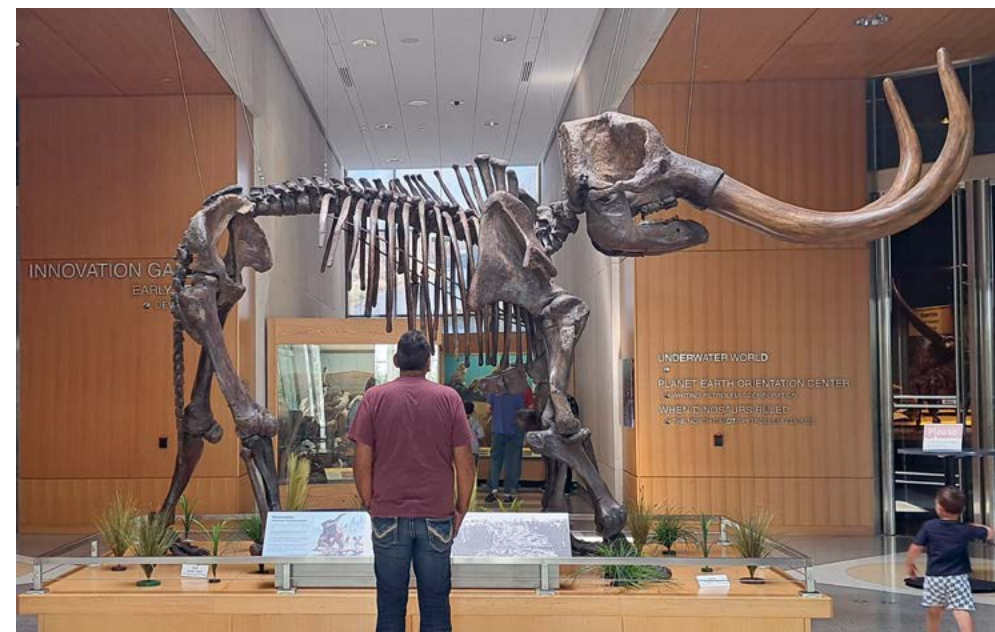
Een van de (vele) blikvangers van het North Dakota Heritage Center & State Museum is dit mammoetskelet

gezin. Ook op een winderige en natte dag is 'Fort Lincoln' absoluut een omweg waard.