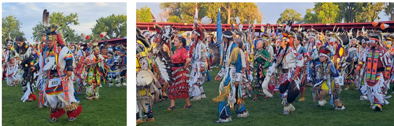
Kleurrijk, zinderend, overweldigend: de UTTC International Powwow in Bismarck is een onvergetelijke en intense ervaring

'De dansende stoet is hypnotiserend, de ambiance adembenemend, de muziek en dans indringend'