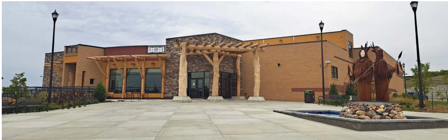
De expositieruimte en cultureel centrum van het MHA Interpretive Center alleen al is een plaatje