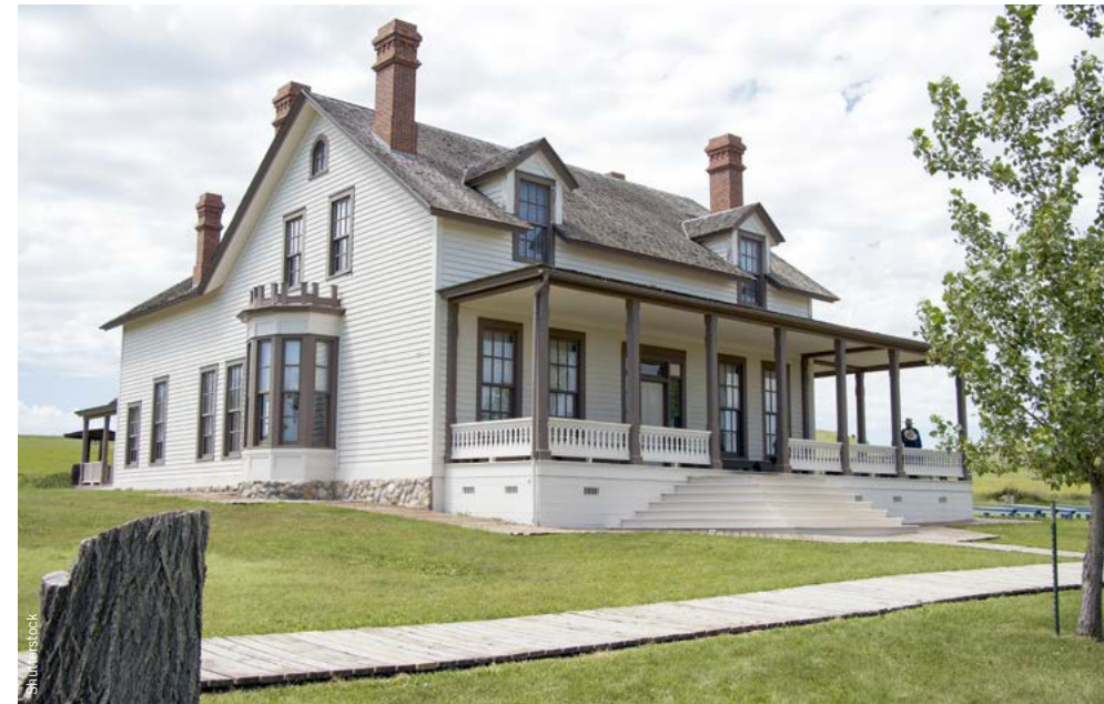
Custer House bij Fort Abraham Lincoln State Park

De wind is er zeker als we Fort Abraham Lincoln bereiken, de voormalige militaire post vlak bij Bismarck. Het hoofdingrediënt van fort en hout, dus zijn veel van de verdedigingswerken en barakken daarmee herbouwd. Dat geldt ook voor On-a-Slant Village, een voormalig Mandan-dorp. Mocht je de heuvelwoningen in MHA National Interpretive Center hebben gemist, zie hier een nieuwe kans. Dé publiekstrekker is de voormalige woning (ook herbouwd, trouwens) van de beroemde generaal George Armstrong Custer – die van de Slag bij Little Bighorn (1876) – en zijn