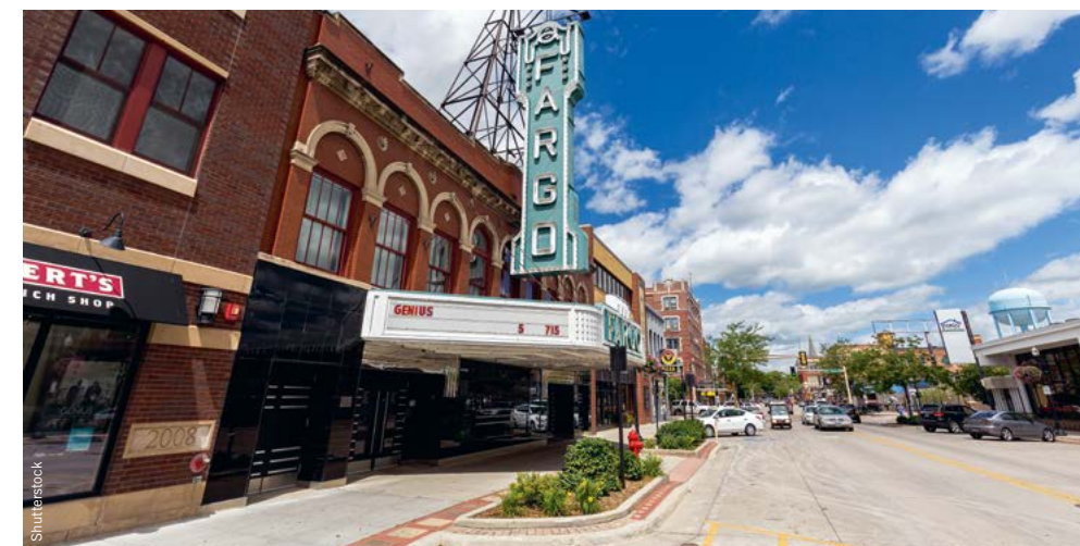
De blikvanger in Fargo is het filmtheater

de respect afdwingende bizens, de grappige grondeekhoorns, de eindeloze groene vlaktes, de rijke cultuur van de Mandan, Hidatsa en Airikara Nation, allemansvriend Fargo en de onvergetelijke powwow van Bismarck en de gastvrijheid van de North Dakotans...deze staat is inderdaad legendarisch. En als je legendary bent, verdien je wat ons betreft iets meer dan tweeënhalve pagina in de blauwe bijbel of welke reisgids ook...★