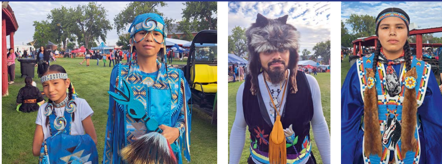
De kleurrijke en trotse gezichten van de United Tribes Technical College International Powwow