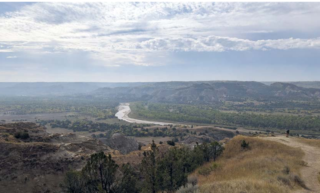
Prachtige vergezichten zijn verzekerd in zowel de North als de South Unit van Theodore Roosevelt National Park

De North Dakota 23 is een van de eindeloze droplinten die de enorme staat doorkruisen. Links een boerderij, rechts een aardolieveld, recht voor je een kaarsrechte streep asfalt waarop af en toe een enorme truck (die een gargantueske olietank meezeult) voorbij dendert. Als je op de hoofdwegen blijft plakken, snap je misschien waarom Lonely Planets twaalfde editie van USA (een vuistdikke knaap van meer dan twaalfhonderd pagina's) slechts tweeënhalve pagina's tekst besteedt aan North Dakota. De aan de Canadese provincie Manitoba (ook geen toeristenmagneet) vastgeplakte staat heeft daarmee de minste 'zendtijd' van alle Amerikaanse staten. Aan de andere kant zijn er genoeg reisbijbels die helemaal geen aandacht besteden aan North Dakota.