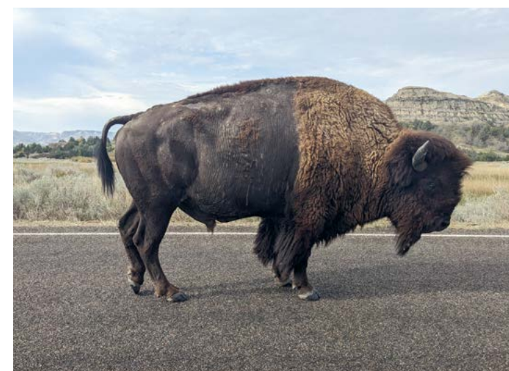
In het nationale park is de kans op een up close and personal met een bizon bijna 100 procent