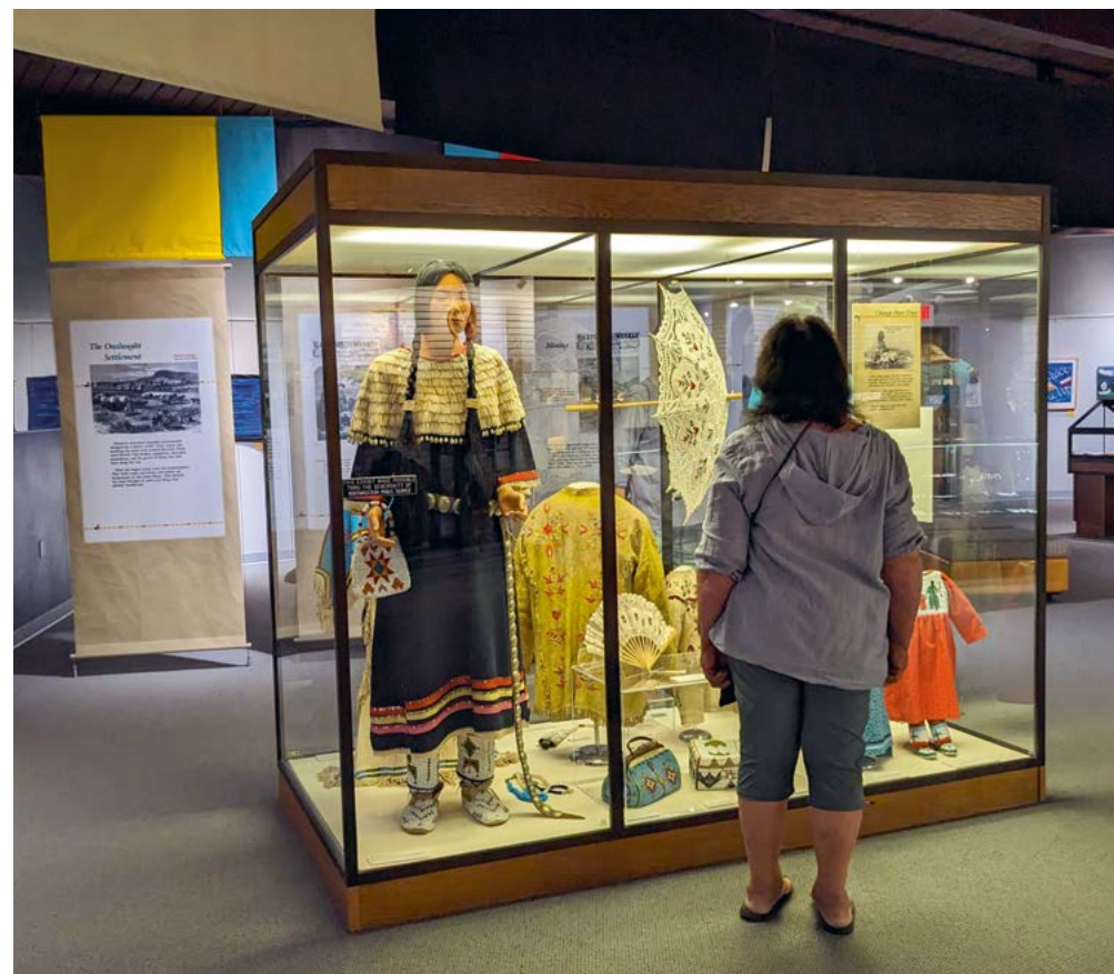
Akta Lakota is geen groot museum, maar is zeer informatief en is een schatkamer aan voorwerpen van de oorspronkelijke bewoners