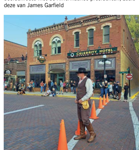
Schietgrage acteurs die het Wilde Westen weer wakker knallen, zijn in Deadwood nooit ver weg