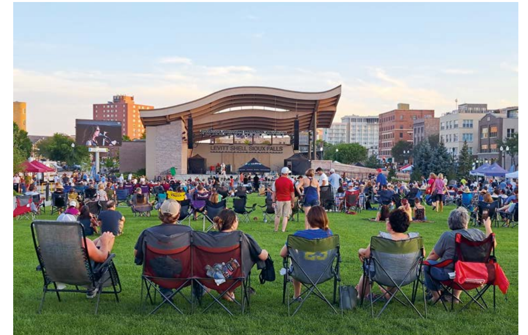
In de zomermaanden vinden in Sioux Falls allerlei culturele activiteiten plaats, zoals hier in het laatste weekend voor Labor Day

Dat het boerenleven in South Dakota tegenwoordig iets comfortabeler is, ontdekken we later op de South Dakota State Fair in Huron. Naast het standbeeld van ’s werelds grootste fazant (de state bird van South Dakota) biedt deze stad de jaarlijkse terugkerende mix van landbouwbeurs, kermis en braderie. Niet het