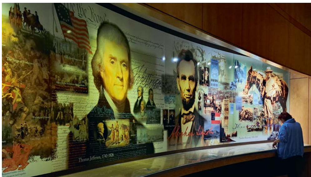
Het fraaie museum bij Mount Rushmore