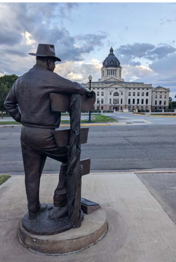
Hét oriëntatiepunt van South Dakota's hoofdstad Pierre is de fraaie State Capitol