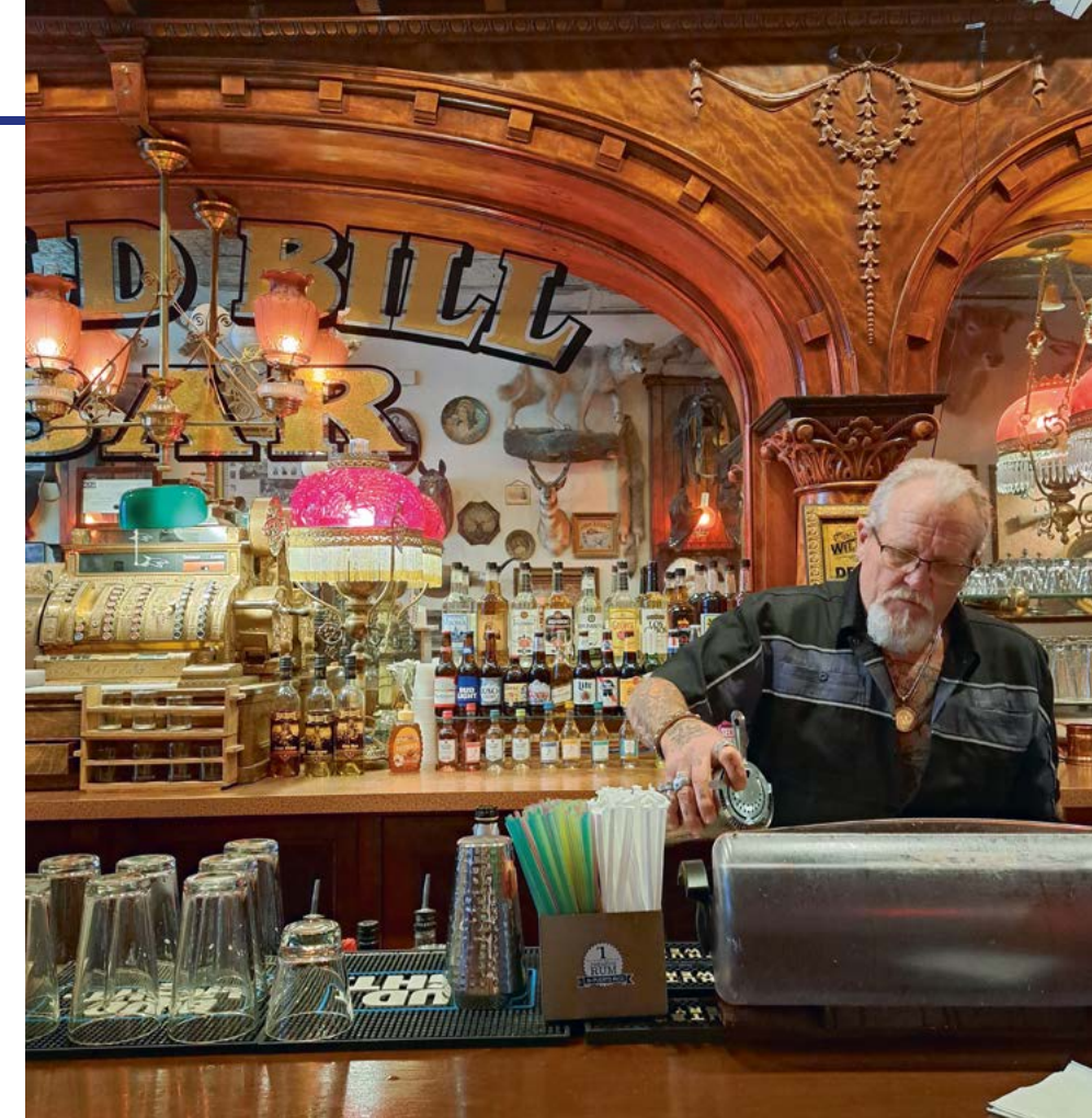
In Saloon Nr 10 dronk, pokerde en stierf Wild Bill Hickok. Zijn naam wordt hier nog altijd in gouden letters geschreven

In de zomereditie vervolgen we onze roadtrip richting North Dakota