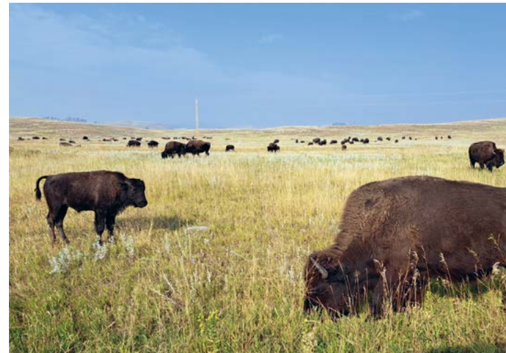
De bizons zijn natuurlijk dé topattractie van Custer State Park