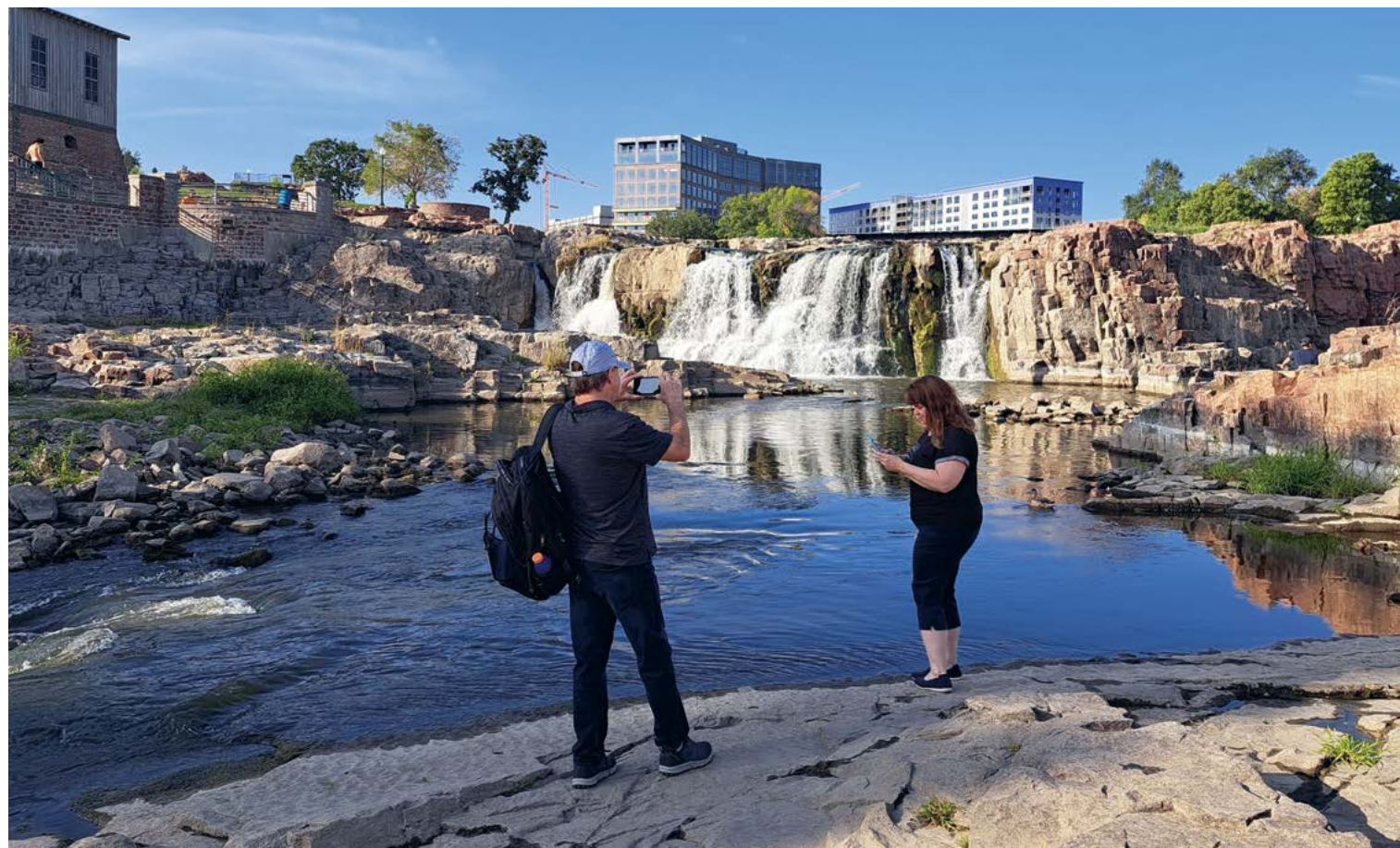
In de droge zomers klettert en spettert het aanmerkelijk minder in Falls Park, niettemin blijven de watervallen een topattractie

‘Niet het uitje dat je in de reisgidsen tegenkomt, maar zover ‘het echte Amerika’ bestaat, komen evenementen als deze daar aardig dichtbij’