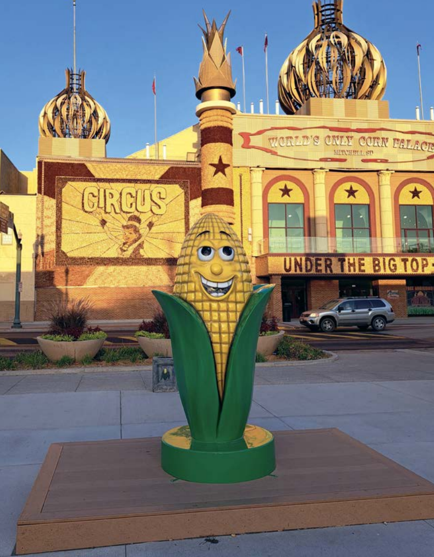
Het hoofdbestanddeel van Amerika's ontbijtdeet staat in Mitchell letterlijk op een voetstuk