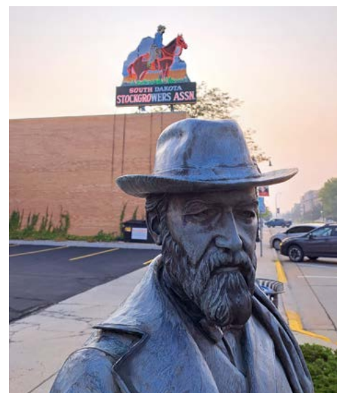
Eén van de publiekstrekkingen van Rapid City is een beeldenroute met de Amerikaanse presidenten, zoals deze van James Garfield