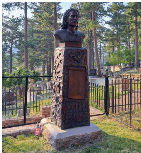
Mount Moriah – waar Wild Bill Hickok en Calamity Jane begraven liggen – is een van de bezienswaardigste plekken van Deadwood