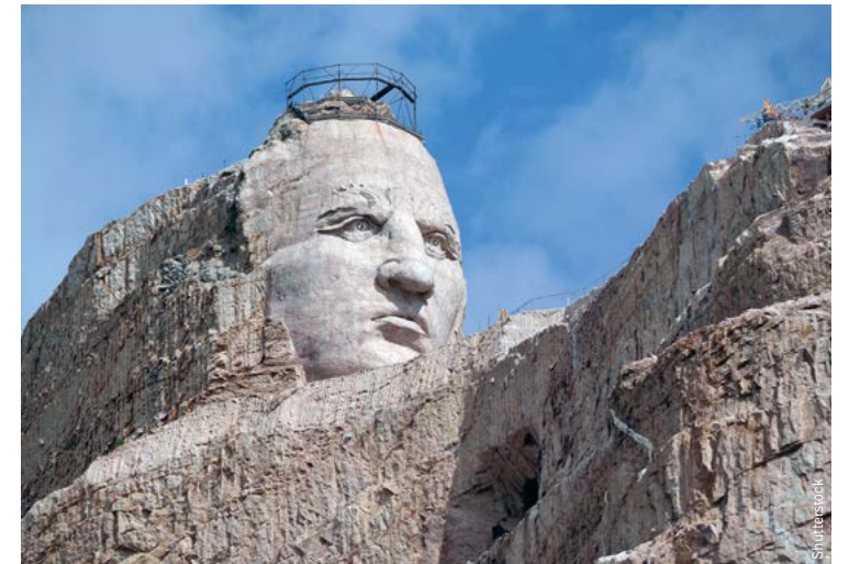
Werk (nog altijd) in uitvoering: de bouwers van Crazy Horse Memorial moeten het hebben van toegangsgelden en giften