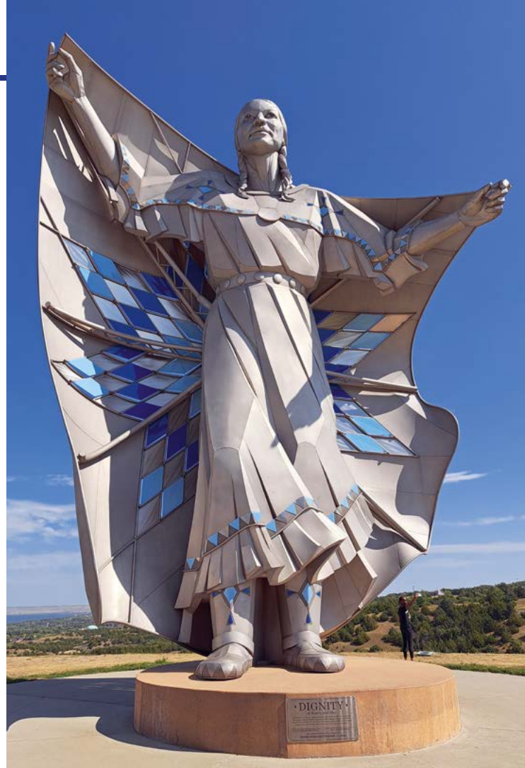
Dignity of Earth and Sky is alleen al vanwege de fantastische ligging langs de Missouri een fotostop waard