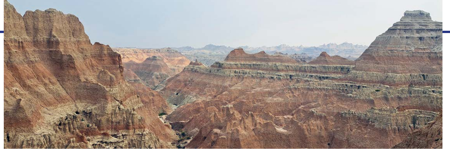
Badlands National Park is een van South Dakota's kroonjuwelen