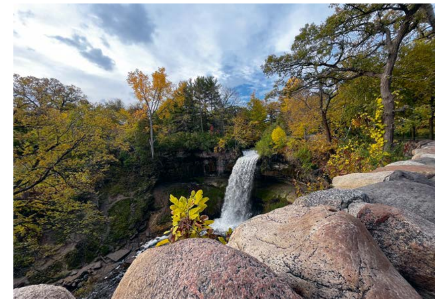
Minneapolis heeft haar eigen 'stadswaterval'