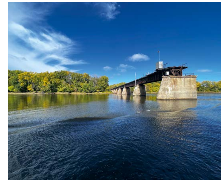
Een kabbelend uitje: varen over de Mississippi bij de Twin Cities