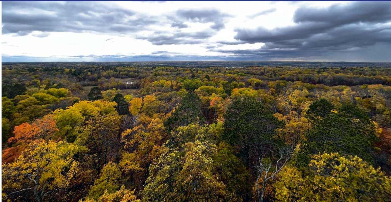
De herfst tooit de kruinen van de bomen in het Itasca State Park

V an de vierhonderdduizend Nederlanders die zich tussen 1845 en 1930 in de Verenigde Staten vestigden, streek een deel neer in Zuidwest-Minnesota. Niet verrassend, gezien het vlakke en langs een liniaal getrokken boerenland. Op weg van Sioux Falls, South Dakota naar de bron van de Mississippi, verandert in de buurt van Pelican Rapids pas het uitzicht. Als snoepgoed in december zijn tientallen meren over de zojuist nog eindeloze, monotone akkers uitgestrooid. Plukjes bomen in herfststonaat versieren de glooiende heuvels. Als een slang kronkelt Route 59 richting het Itasca State Park. Dit is rijden door een ansichtkaart. Het bonte patchwork van het najaar, gelardeerd met glooiend boerenland, spiegelde meren en af en toe een rode, houten schuur. Bob Ross zou zijn kwast er met plezier in dopen. Het is om in te lijsten.