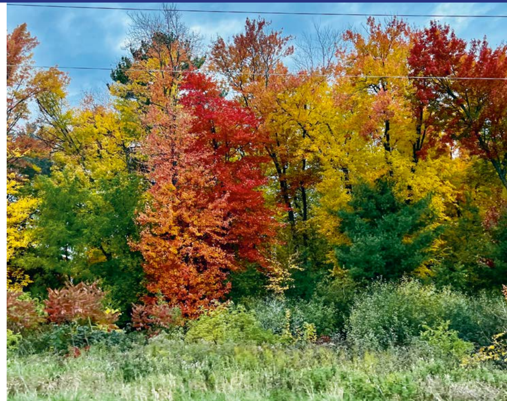
Het najaar in bloei

Bemidji. Een plaats die bekend staat als The First City on the Mississippi River .