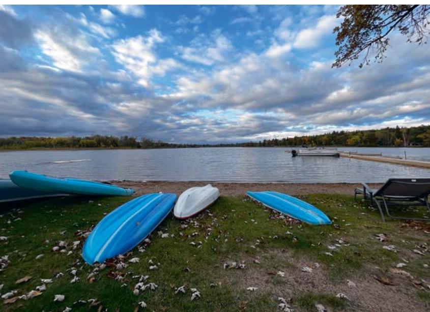
Als herinneringen aan een lange zomer liggen de kajaks op het strand