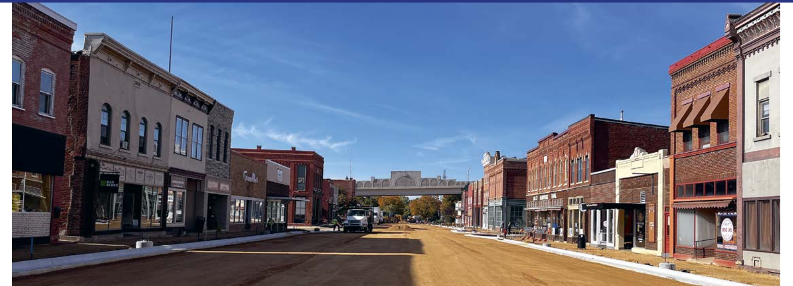
De renaissance van de rivierstadjes in beeld in Wabasha

'Nog één keer glinstert de Mississippi River in de achteruitkijkspiegel. Dan stroomt ze verder zuidwaarts'