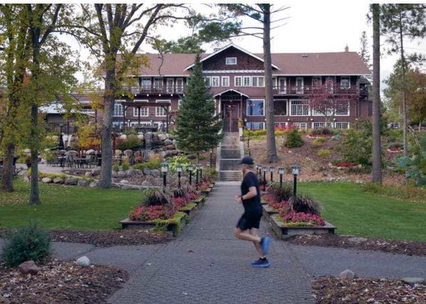
De Grand View Lodge is anno 2023 nog steeds een heerlijke pleisterplaats

De Great River Road brengt reizigers aan de Minnesota-kant naar het attractieve Red Wing. De plaats heeft een historisch hart waar het hoofdkantoor van het gelijknamige internationale schoenenmerk is gevestigd. Er tegenover is de flagship store van het merk en een van de, letterlijk, grootste attracties van het plaatsje: The World's Largest Boot. Schuin tegenover de bijna zeven meter hoge laars met maatje 638,5, staat het historische St. James-hotel waar de beste wilde rijstsoep van de staat wordt geserveerd. Andere trekpleisters zijn het Pottery Museum en het boetiekwinkelcentrum The Pottery Place.