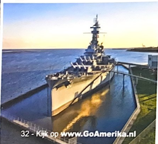
32 - Kijk op www.GoAmerika.nl

Amerikanen vanuit het hele land komen speciaal naar Alabama voor de prachtige stranden aan de Golf van Mexico. Het witte zandstrand strekt zich uit over 50 kilometer en is de perfecte plek om te zonnen. Breng een bezoek aan de beroemde Flora-Bama Bar waar dagelijks live muziek wordt gespeeld. Verder vind je hier heerlijke visrestaurants, diverse shopping malls en het Gulf State Park.