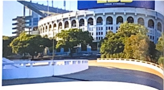
Zo'n 45 kilometer van Mobile af ligt Bayou la Batre, bekend van de film Forest Gump. Dit is ook een leuk authentiek vissersstadje, dat Mobile voorziet van heerlijke verse zeevruchten.

In Alabama vind je ook veel steden die onderdeel uitmaken van de US Civil Rights Trail. Montgomery heeft verreweg de meeste historische plekken in verband met de Civil War en Civil Rights. Hier kwam Martin Luther King preken, wat leidde tot het oprichten van de Civil Rights Movement in Amerika. Je kan naar het Rosa Parks Museum, genoemd naar de vrouw die weigerde op te staan om naar achterin de bus te gaan. Dit leidde tot een jaarlange boycot van het busbedrijf. Bij het Alabama State Capitol werd gedemonstreerd voor stemrecht.