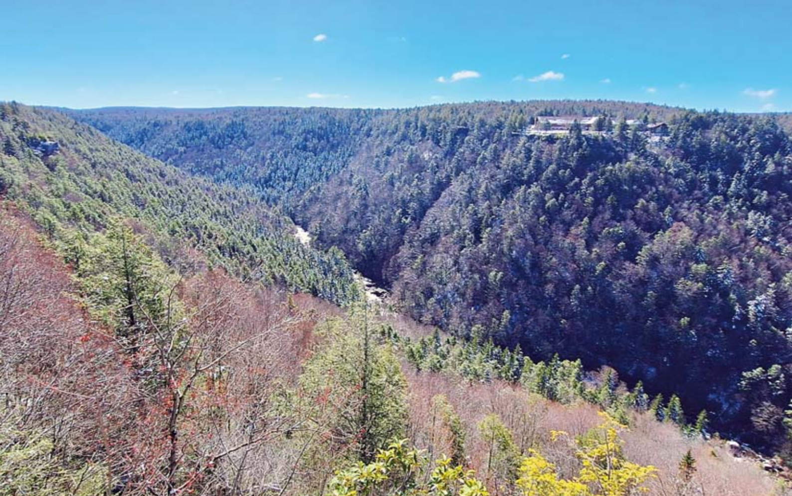
Linkerpagina vanaf linksboven met de klok mee Black Water State Park Lodge biedt een prachtig uitzicht over het park; Wandelen bij Seneca Rocks; Seneca Rocks gezien vanaf het bezoekerscentrum; Blackwater Falls