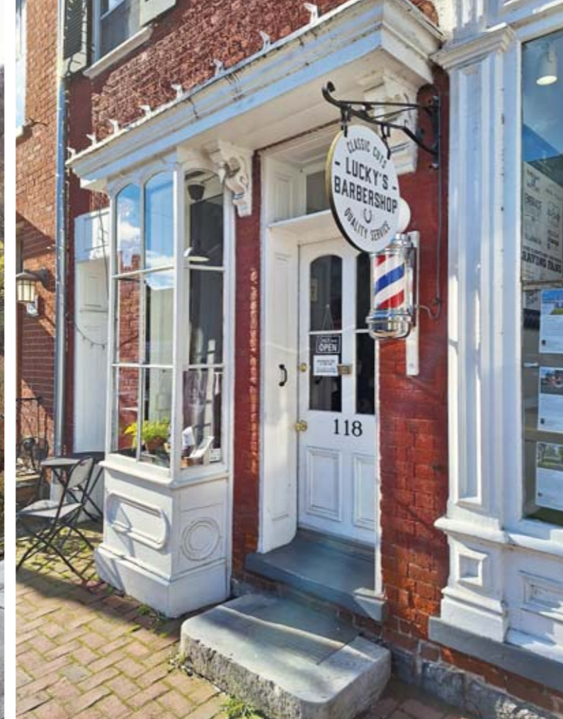
Openingsfoto Uitzicht over Harpers Ferry Linkerpagina vanaf linksboven met de klok mee De hoofdstraat van Harpers Ferry; Karakteristieke winkelpui in Shepherdstown; De gids tijdens de ghost tour; Het stadhuis van Shepherdstown

van de stad te verkennen via musea, rondleidingen en interactieve tentoonstellingen. Vandaag de dag trekt Harpers Ferry bezoekers die geïnteresseerd zijn in de geschiedenis van de Verenigde Staten, het abolitionisme en de Burgeroorlog, en biedt het een diepgaande blik op deze cruciale periodes in de Amerikaanse geschiedenis.