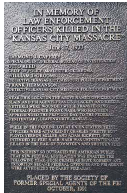
Een plaquette aan de muur van Union Station herinnert aan de Kansas City Massacre