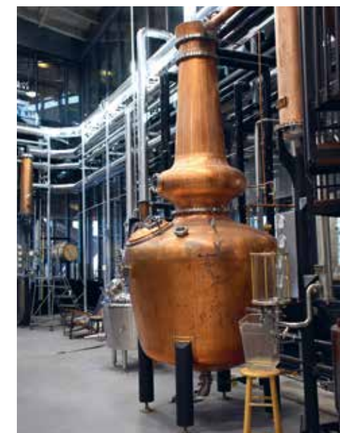
Een rondleiding door de distilleerderij van J. Rieger & Co.

ze het groter aan: hier gooi je met een bijl op een bord. We komen er snel achter dat het toch wat moeilijker is dan het op eerste gezicht lijkt. Onze eerste bijlen belanden ver naast het bord en zelfs op de grond voor het bord. Onze instructeur is echter het geduld zelve en blijft ons coachen. Na een half uur raken we de roos. Kwestie van oefening baart kunst, of gewoon stom geluk? Who cares! Wij hebben de roos geraakt met de (her) ontdekkingstocht door Kansas City.