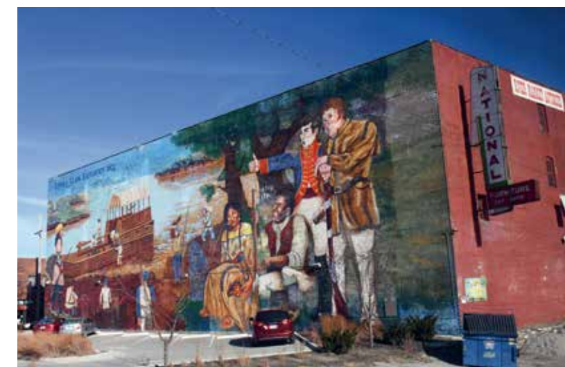
Fraaie muurschilderingen downtown