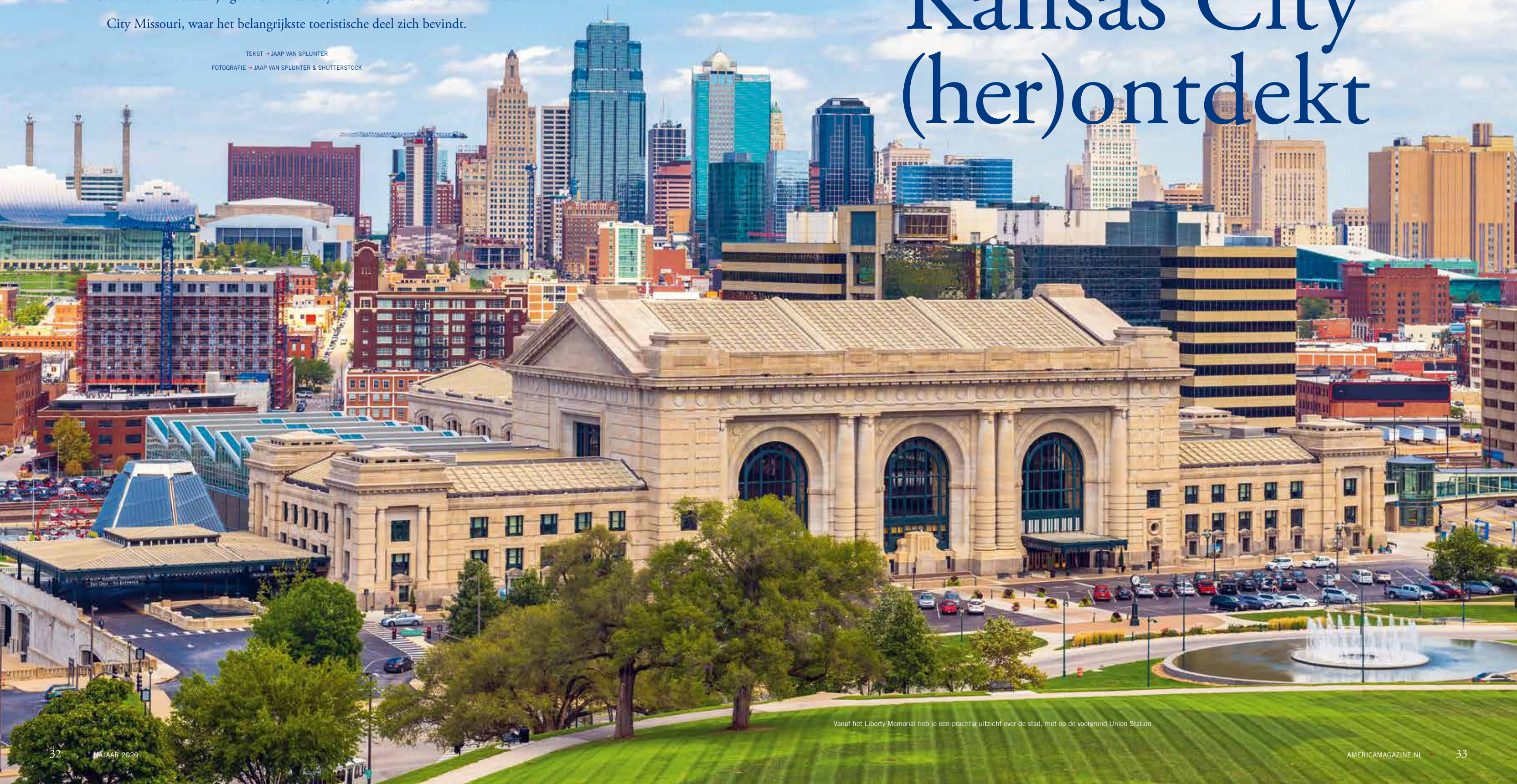
Vanaf het Liberty Memorial heb je een prachtig uitzicht over de stad, met op de voorgrond Union Station