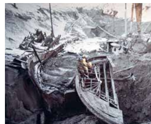
Het was een hels karwei om het schip uit een laag van vijf meter dikke modder te bergen