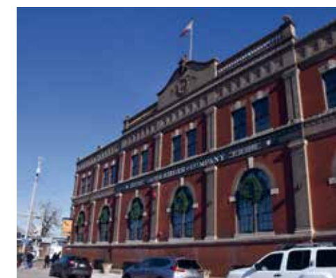
J. Rieger & Co., de iconische distilleerderij van Kansas City