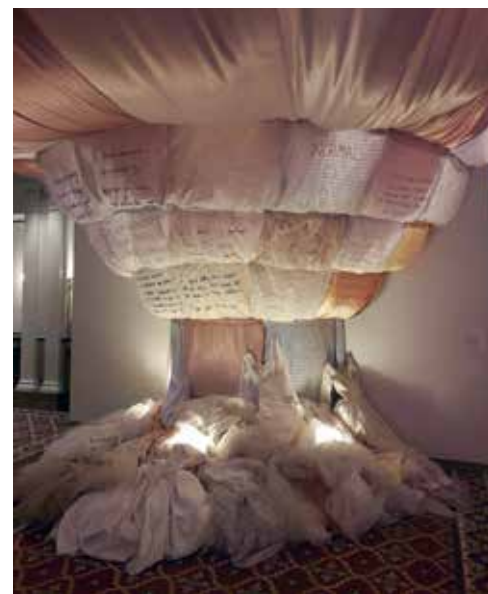
Kunst in de lobby van het 21C Hotel in Kansas City

Bij aankomst op vliegveld KCI lijkt het alsof er niet veel is veranderd. Misschien een likje nieuwe verf, maar voor de rest dezelfde wat troosteloze terminal. Nadat we onze intrek hebben genomen in 21C Hotel in hartje binnenstad, vallen we echter van de ene verbazing in de andere. Het begint al met het hotel, dat onderdeel uitmaakt van een bekende keten van kunsthôtels. In Kansas City is het historische Savoy Hotel and Grill helemaal omgetoverd tot het 21C Kansas City. Hier ben je omringd door hedendaagse kunst in dit boetiekhotel, dat soms net een museum lijkt, inclusief een vooraanstaand restaurant waar een chef-kok aan het roer staat. Beroemde mannen als de (oud)presidenten Harry S. Truman, Theodore Roosevelt en William Taft, en een van Amerika's