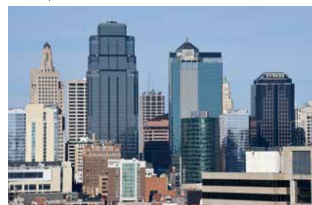
De fraaie skyline