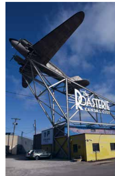
Een originele DC-3 staat op het dak van The Roasterie