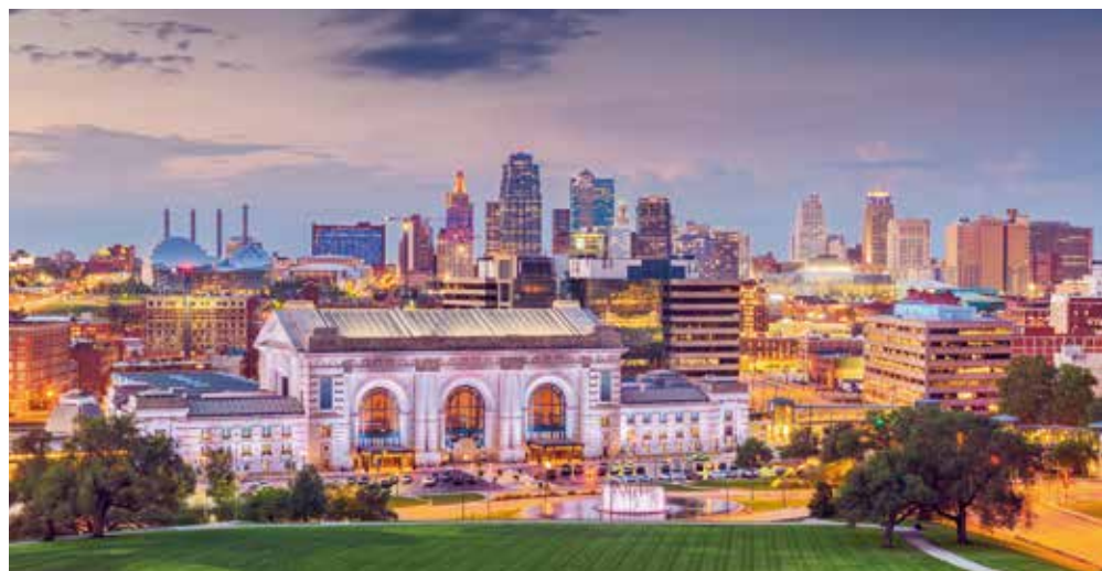
Union Station en de skyline bij avond, gezien vanaf het Liberty Memorial

rijkste zakenmannen John D. Rockefeller waren hier graag geziene gasten. Met de ligging tussen het Power & Light District en de River Market, is er in de directe omgeving van het hotel al veel te zien en te doen.