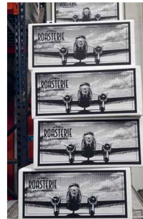
Verpakte koffie: klaar voor verzending