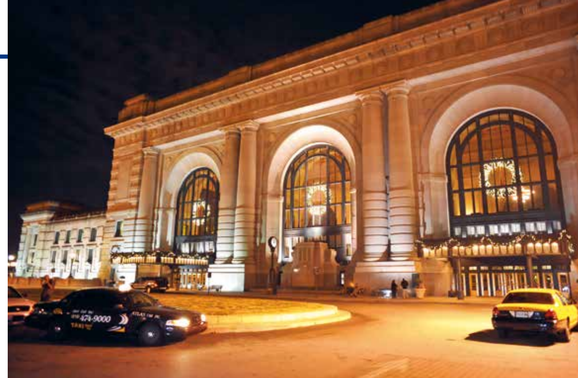
Union Station is 's avonds vaak prachtig verlicht