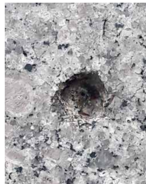
Naar wordt beweerd is dit kogelgat nabij de ingang van Union Station het resultaat van de Kansas City Massacre

Van koffie naar whisky is een kleine stap in Kansas City. We hebben een rondleiding van een uur geboekt door J. Rieger & Co., de iconische distilleerderij van Kansas City, gelegen in de historische wijk Electric Park, East Bottoms. Hier leer je alles over dit onvervalste Kansas City-merk, van de oprichting tijdens de wilde en rauwe jaren toen de stad 'het natste blok ter wereld' werd genoemd, tot zijn vroegtijdige ondergang bij het aanbreken van de Drooglegging en de uiteindelijke heropleving in 2014, bijna een eeuw later. Tijdens de tour maak je kennis