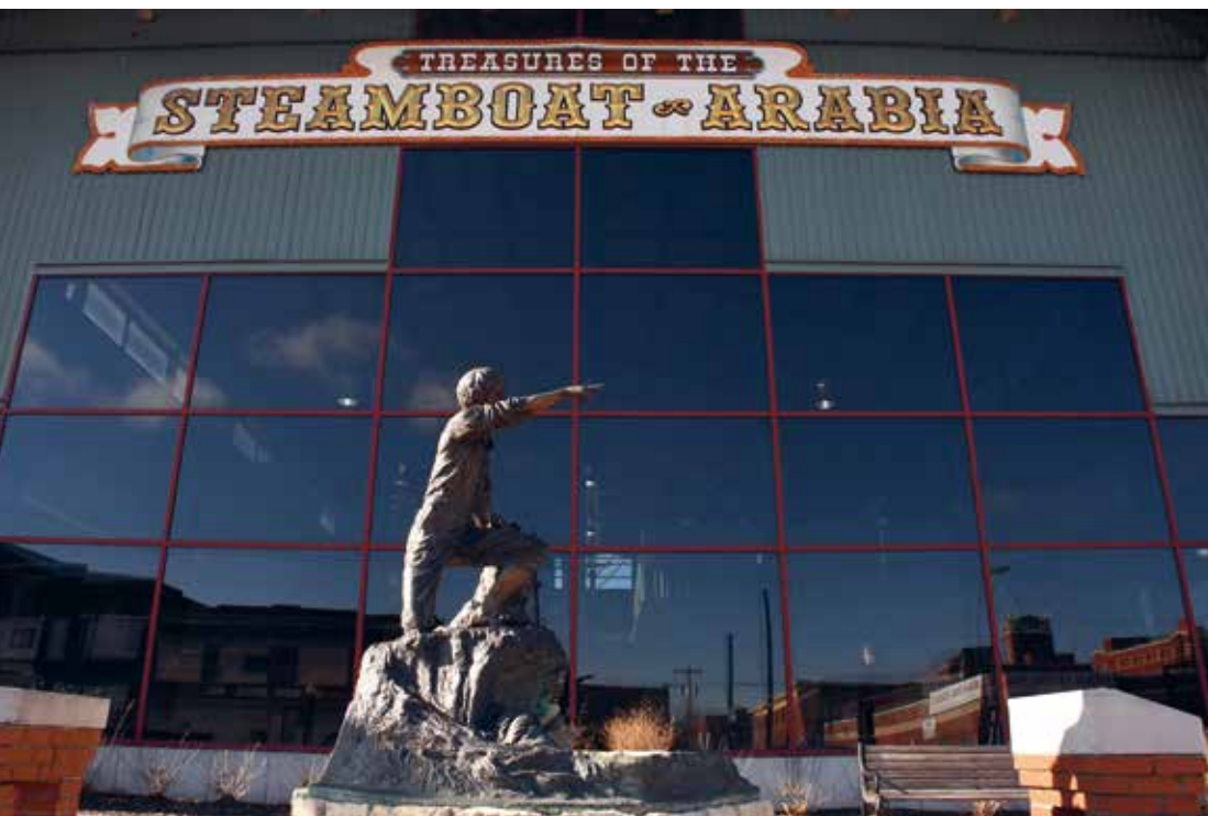
Het Arabia Steamboat Museum