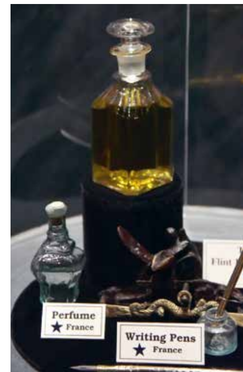
Er werd van alles gevonden: het lijkt wel een tijdscapsule