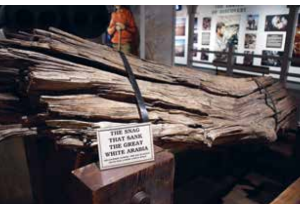
Dit is de reden dat de raderstoomboot zonk: het liep op deze boomstronk