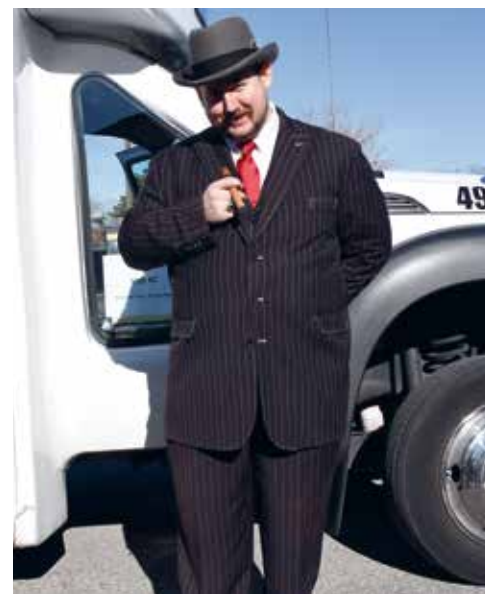
De gids van de Kansas City Gangster Bus Tour is verkleed als een echte gangster, inclusief krijtstreppak en fedora

Aan de voet van Penn Valley Park en het museum, ligt het in 1914 geopende Union Station. Het is gebouwd in beaux-arts-stijl en bestaat uit een Grand Hall – met drie grote hangende kroonluchters en een sierlijk bewerkt plafond – en de Grand Plaza. Een grote klok scheidt de twee delen van het gebouw. Dat dit station met zoveel pracht en praal werd gebouwd, was vanwege de centrale ligging van Kansas City: het was een hub voor zowel personen- als goederenvervoer per spoor. De omvang van het gebouw weerspiegelt deze status. Vanwege de snel dalende aantallen passagiers en goederen werd het station in 1985 gesloten. Na een grote restauratie werd