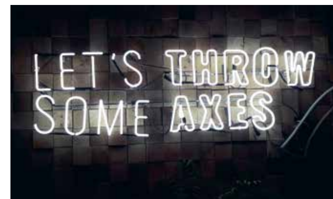
Bijlgooien is toch wat moeilijker dan het op het eerste gezicht lijkt