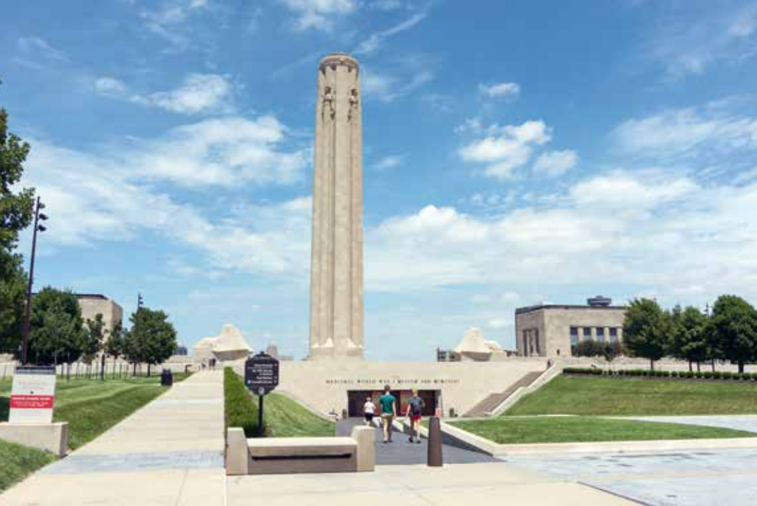
Het National World War I Museum met het Liberty Memorial

Het moet in de jaren negentig van de vorige eeuw zijn geweest dat we regelmatig aanvroegen op Kansas City International Airport (KCI). Een vliegveld dat perfect is gelegen als je het Heartland of America wilt bezoeken. Vanuit hier liggen minder bekende en daardoor ook minder bezochte staten als Kansas, Missouri, Arkansas, Iowa en Nebraska binnen handbereik. Gaan de meeste bezoekers aan de Verenigde Staten in eerste instantie vooral naar New York City, Florida en het zuidwesten, onze verkenning van dit enorme land begon ooit of all places vanuit hier. De eerlijkheid gebiedt te zeggen dat we vanaf het vliegveld meteen verder trokken en slechts één keer Kansas City zelf bezochten. En dat viel niet mee, want dit was een enigszins verpauperde stad. De laatste jaren bereiken ons steeds meer berichten dat Kansas City een metamorfose heeft ondergaan en zich tot een trendy stad heeft ontwikkeld, een stad die schreeuwt om (her)ontdekt te gaan worden.