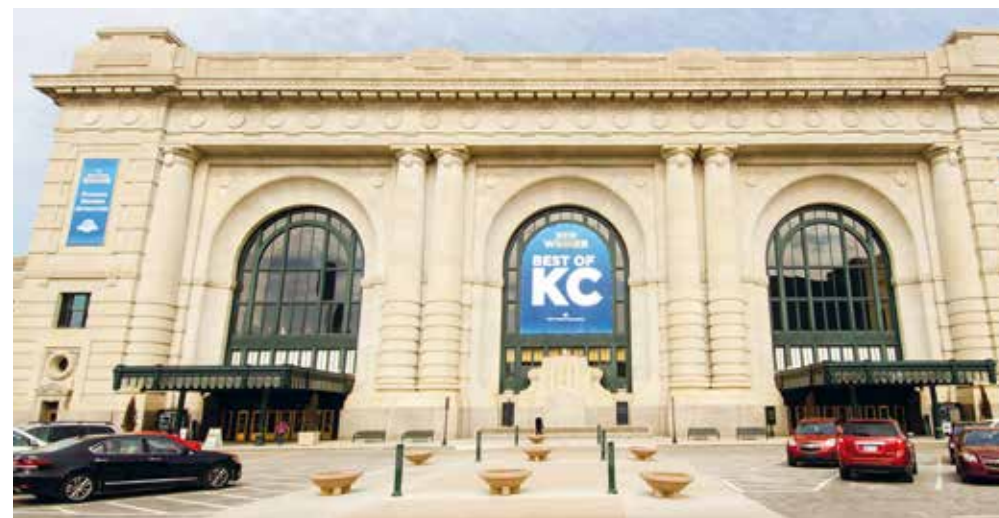
Union Station is gebouwd in beaux-arts-architectuur

het station in 1999 weer heropend, met vooral een reeks van musea en andere openbare attracties. In 2002 keerde Amtrak weer terug met het spoor en sindsdien is het weer een druk treinstation geworden.