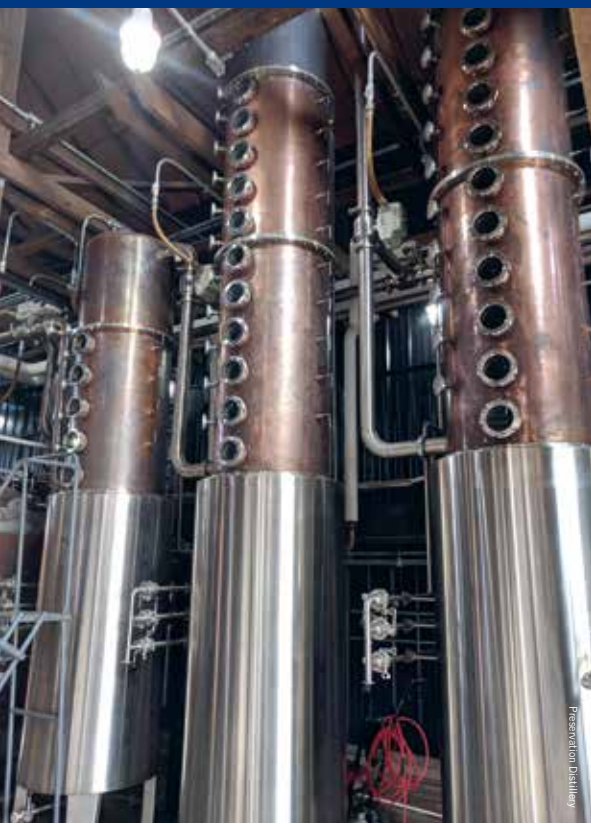
De Preservation Distillery streeft naar honderd procent duurzaamheid