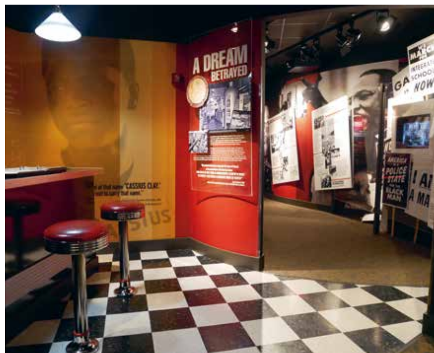
Repro van de bar waar goudenmedaillewinnaar Muhammad Ali vanwege zijn huidskleur geweigerd werd