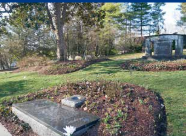
Op Cave Hill Cemetery in Louisville vind je de laatste rustplaats van The Greatest