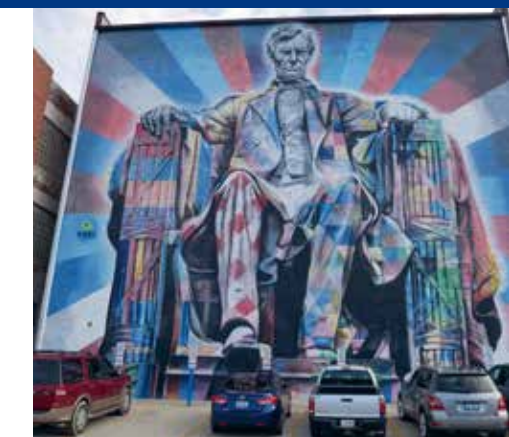
Lincoln zag op 12 februari 1809 het licht op de Sinking Spring Farm bij Hodgenville