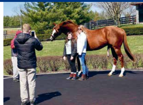
Miljoenenpaard California Chrome was in 2016 winnaar van de Kentucky Derby

De winnaar van de Kentucky Derby, de Preakness Stakes en de Dubai World Cup was in 2016 California Chrome. Dit meest succesvolle paard ever met meer dan veertien miljoen dollar prijzengeld, is inmiddels met pensioen en aan de slag als dekhengst. Zo'n 250 keer per jaar bespringt hij een merrie, of handwarm turntoestel. Kosten: 35.000 dollar per climax. Tussendoor kun je hem als onderdeel van de California Chrome Experience ontmoeten op de Taylor Made Farm. De boerderij ligt op een steenworp afstand van