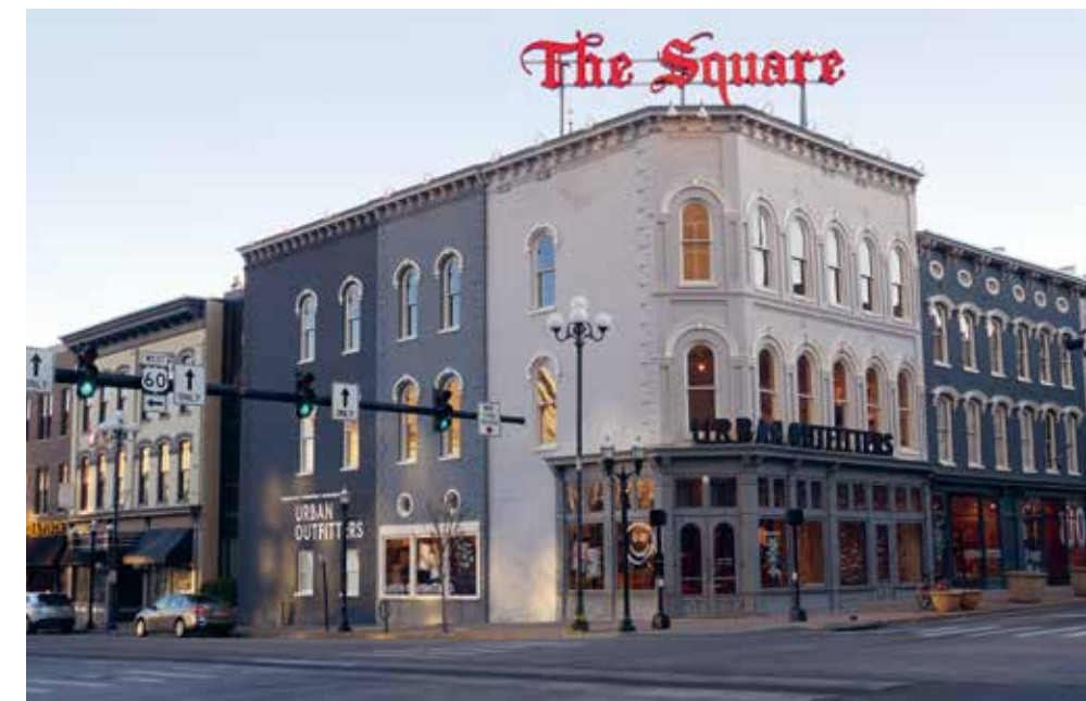
Het centrum van The Horse Capital of the World Lexington

Rijdend over de Old Frankfort Pike van Lexington naar de kleine hoofdstad van de staat, cruise je door een reclame voor Visit Kentucky. Heuvels, gras, houten hekken en bluegrass -muziek op de radio. Aan het eind van de commercial wacht Frankfort. Hier huist, sinds Kentucky in 1792 de vijftiende staat werd, het congres in het enorme Capitol. Het ruim honderd jaar oude gebouw is op doordeweekse dagen tussen 8:00 en 16:30 te bezoeken. Op zaterdag zijn de deuren van 10:00 tot 14:00 geopend. Naast hoofdstad van de staat, is Frankfort ook de geboorteplaats van de Bourbon Ball. De