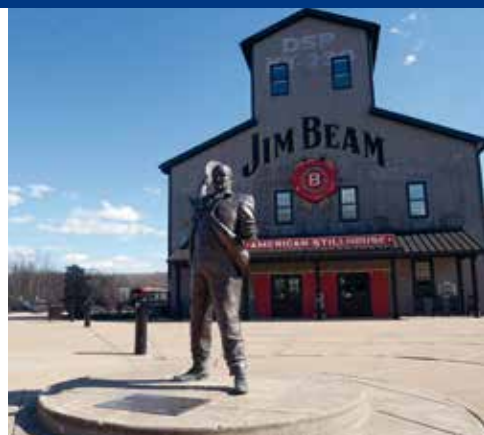
De familie Beam speelt nog steeds een prominente rol in en om The Bourbon Capital of the World