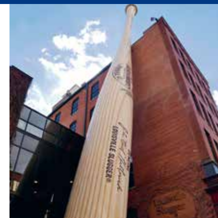
's Werelds grootste honkbalknuppel