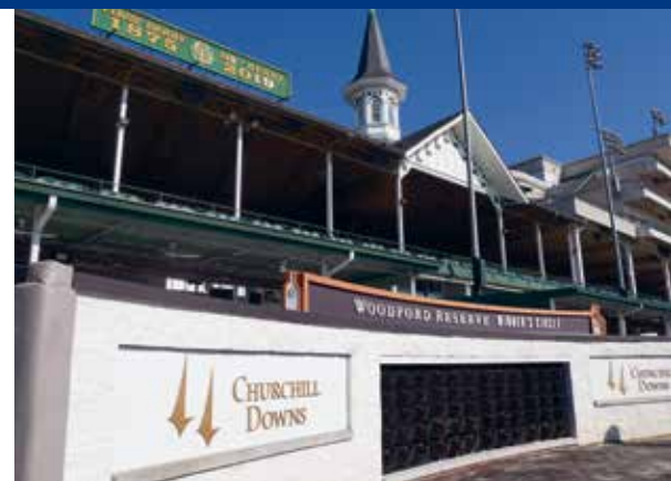
Sinds 1875 galopperen de racepaarden iedere eerste zaterdag van mei over de baan van Churchill Down