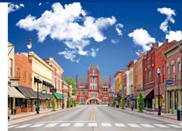
In 2012 werd Bourbon Capital of the World Bardstown uitgeroepen tot mooiste dorp in Amerika