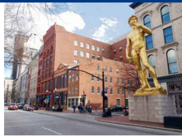
Zowel in Lexington als in Louisville kun je 24/7 kunst opsnuiven buiten en binnen de 21C hotels