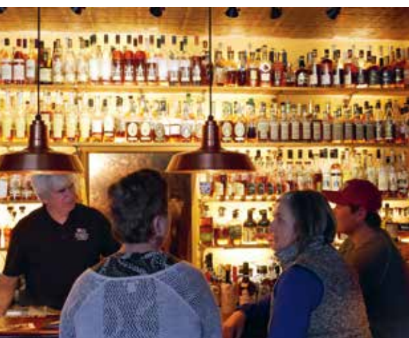
Met een van de 2900 bourbons en whisk(e)ys de keuzestress te lijf in de Prohibition Bar

Waar denk je aan als je Kentucky hoort?, is de vraag die op ieders lip lijkt te branden, of het nu in Covington, Lexington, Bardstown of Louisville is. De onzekerheid die huist in de vraag, verdampt als alcohol in een bourbondistilleerderij bij het horen van het antwoord. Na vijf dagen roadtrippin door deze prachtige staat, dromen we van groene heuvels omlijst door witte hekken. Van koperen ketels, houten vaten en glazen gevuld met amber. Southern charm , het eeuwig stralende aura van Muhammad Ali, herboren stadsleven achter oude muren, bourbon zalm, bourbon milkshakes, bourbon balls en bourbon bier. Op het ritme van een vijfsnaar banjo trekt AmericA door de Bluegrass State . Waar denk je aan als je Kentucky hoort? Aan Neil Diamonds Kentucky Woman :