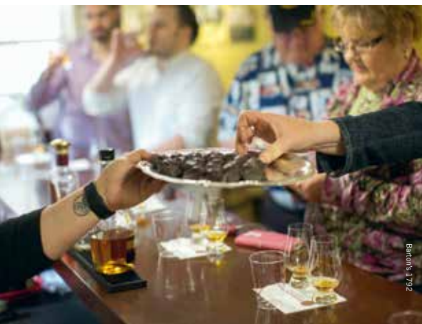
Bourbon Balls zagen in 1936 het licht in een snoepwinkel in Frankfort