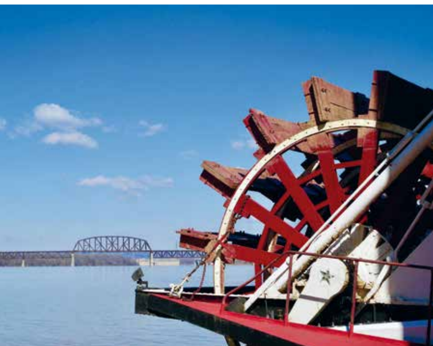
De oudste, nog in gebruik zijnde radarboot The Belle of Louisville

Kentucky (woman) If she get to know you, She goin' to own you Kentucky (woman)