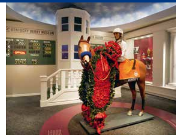
Winnar van de run for the roses in het Kentucky Derby Museum

Chicken. Vlakbij het graf van Colonel Sanders ligt The Greatest . Geboren op 17 januari 1942 als Cassius Clay, overleden op 3 juni 2016 als Muhammad Ali, begraven op Cave Hill Cemetery in zijn geboortestad. Aan de oever van de Ohio River wordt de sportman en de mens geëerd in het Ali Center. In dit centrum trekt naast het leven van haar naamgever, ook de geschiedenis van Louisville en Amerika voorbij. Een grote, glazen pui kijkt uit op de Clark Memorial Bridge. Dit is de brug waar Ali zijn Olympische gouden medaille vanaf gooide, nadat men hem vanwege zijn huidskleur in een restaurant weigerde te bedienen. Zijn hele leven lang zou Ali blijven opboksen tegen racisme en vooroordelen. Net als in de ring zou hij ook in de strijd voor mensenrechten zegenvieren. Op 19 november 2005 opende Muhammad Ali het opvallende gebouw. Het was behalve een erbetoon, het startschot voor de revival van Louisville.