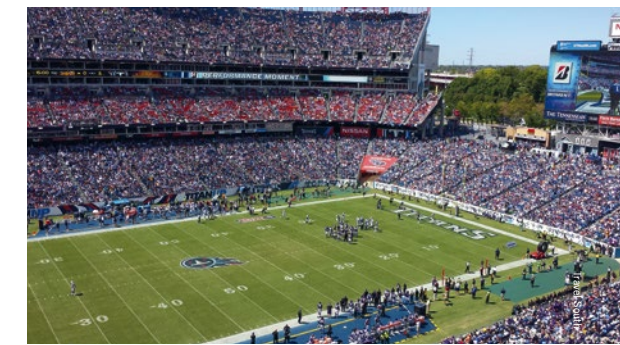
Het stadion van de Tennessee Titans