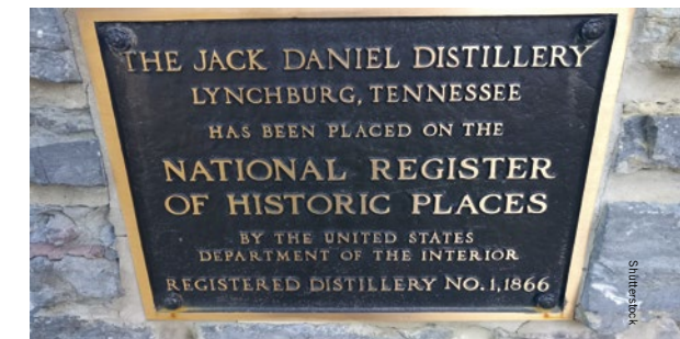
De stokerij is opgenomen in het National Register of Historic Places