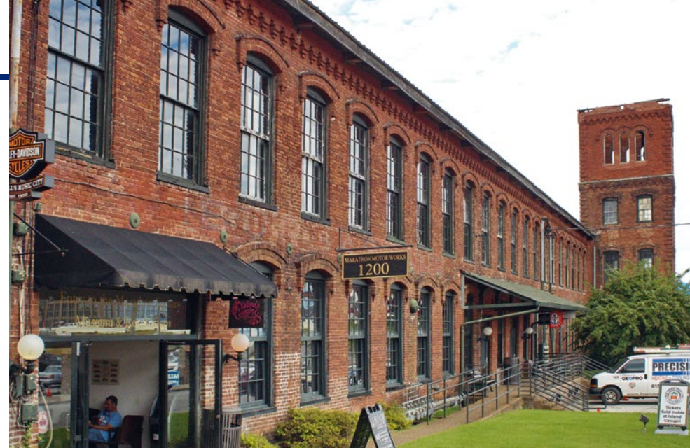
De voormalige fabrieken van Marathon Motor Works