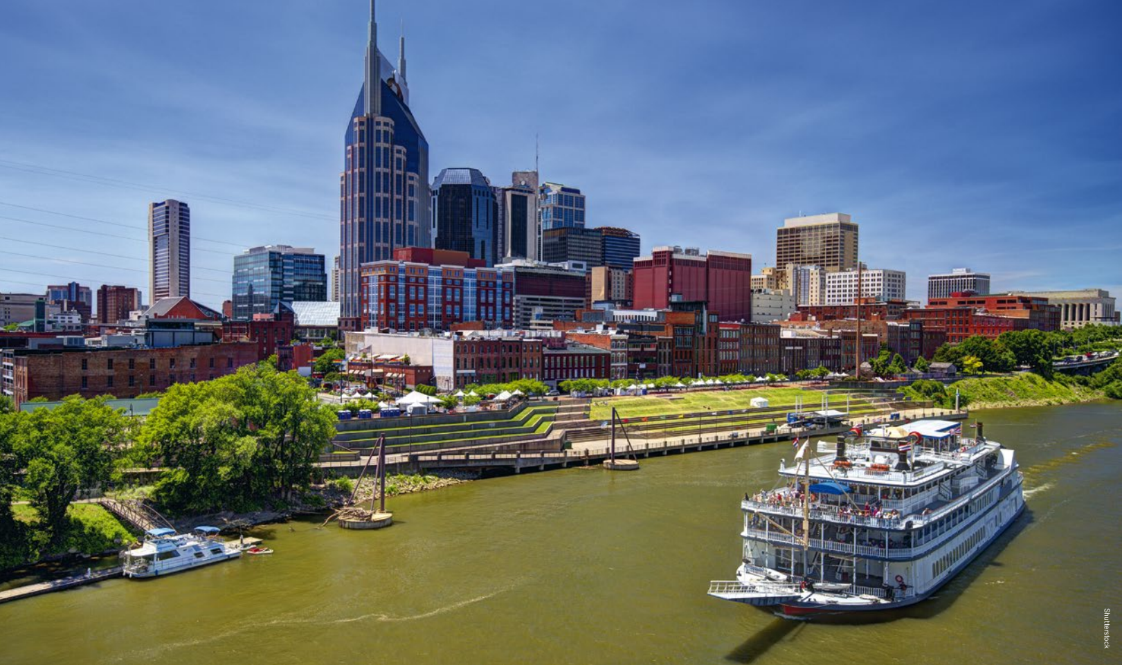
De fraaie skyline van Nashville