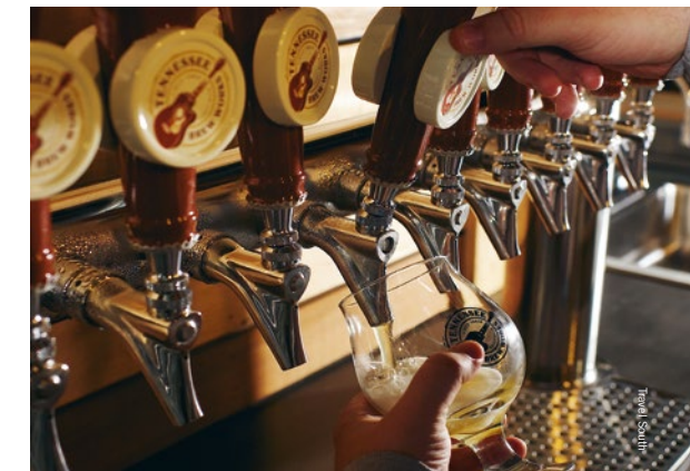
Er is altijd wel een brouwerij te vinden voor een goed biertje