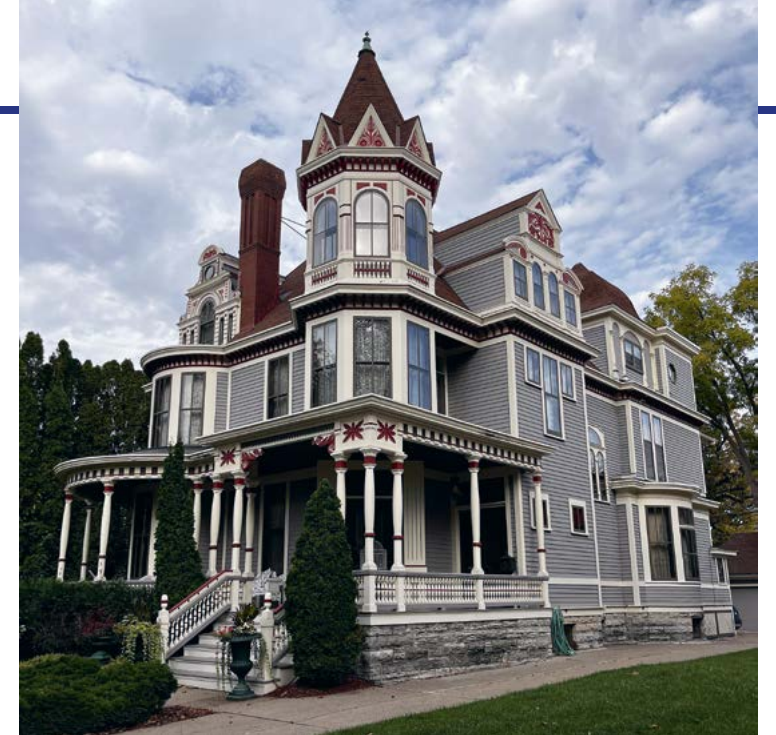
Millionaire Row is de bijnaam van de schitterende Summit Avenue

Cathedral of Saint Paul. De eerste is na dat van Utah verkozen als het mooiste provinciehuis van de VS. De tweede is gemodelleerd naar de Sint-Pietersbasiliek in Rome. En dat zie je. Beide marmeren mastodonten zijn kosteloos te bezichtigen met, in het geval van de kathedraal, kans op een gratis concert van het koor of het orgel. Achter het godshuis begint sinds de jaren vijftig van de negentiende eeuw Summit Avenue. Van de 440 originele woningen aan deze kilometerslange Millionaire Row, staan er nog 373 overeind. Tijdens de kerstdagen is het hier met dank aan de feestverlichting sprookjesachtig. Maar ook de rest van het jaar is het een prachtige laan om over te rijden of langs te wandelen. De beroemdste oud-bewoner van de straat, The Great Gatsby -schrijver F. Scott Fitzgerald, vond zijn straat zelf maar niets en beschreef haar als " A mausoleum of American architectural monstrosities ." Ook sterarchitect Frank Lloyd Wright was geen fan van de stadspaleizen. Hij had het over " The worst collection of architecture in the world ." Maar de jaren zijn mild geweest voor Summit Avenue. Tegenwoordig staat ze bekend als het best bewaarde voorbeeld van de Victoriaanse bouwstijl in de VS.