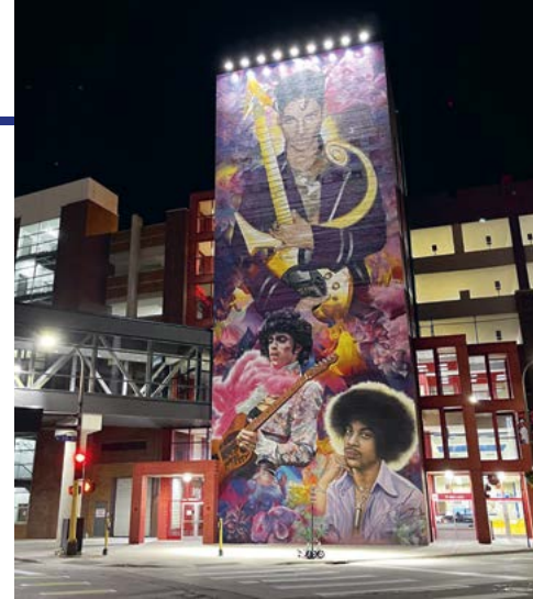
Prince is meer dan levensgroot aanwezig in Minneapolis

één beverfamilie per mijl. En al dat water dat we hier hebben, stond niet alleen aan de basis van het ontstaan van de Twins , we danken er ook een groot deel van onze 103 microbierbrouwerijen aan." De aanwijzingen volgend van deze pepernotenliefhebber, "mijn man en ik bakken ze altijd zelf in december", gaat het per auto van hoogtepunt naar hoogtepunt.