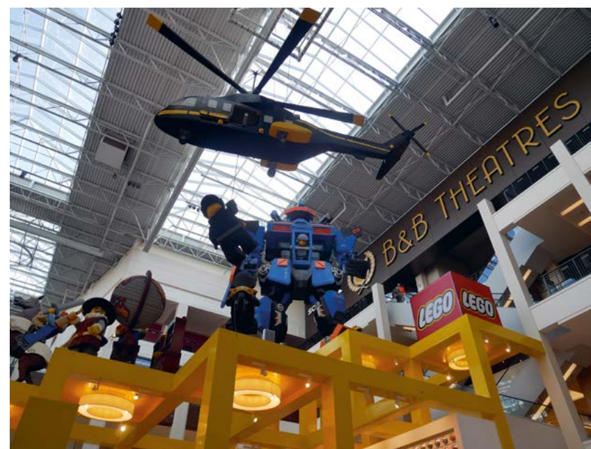
Alles in de Mall of America is groot, dus ook de Lego-winkel