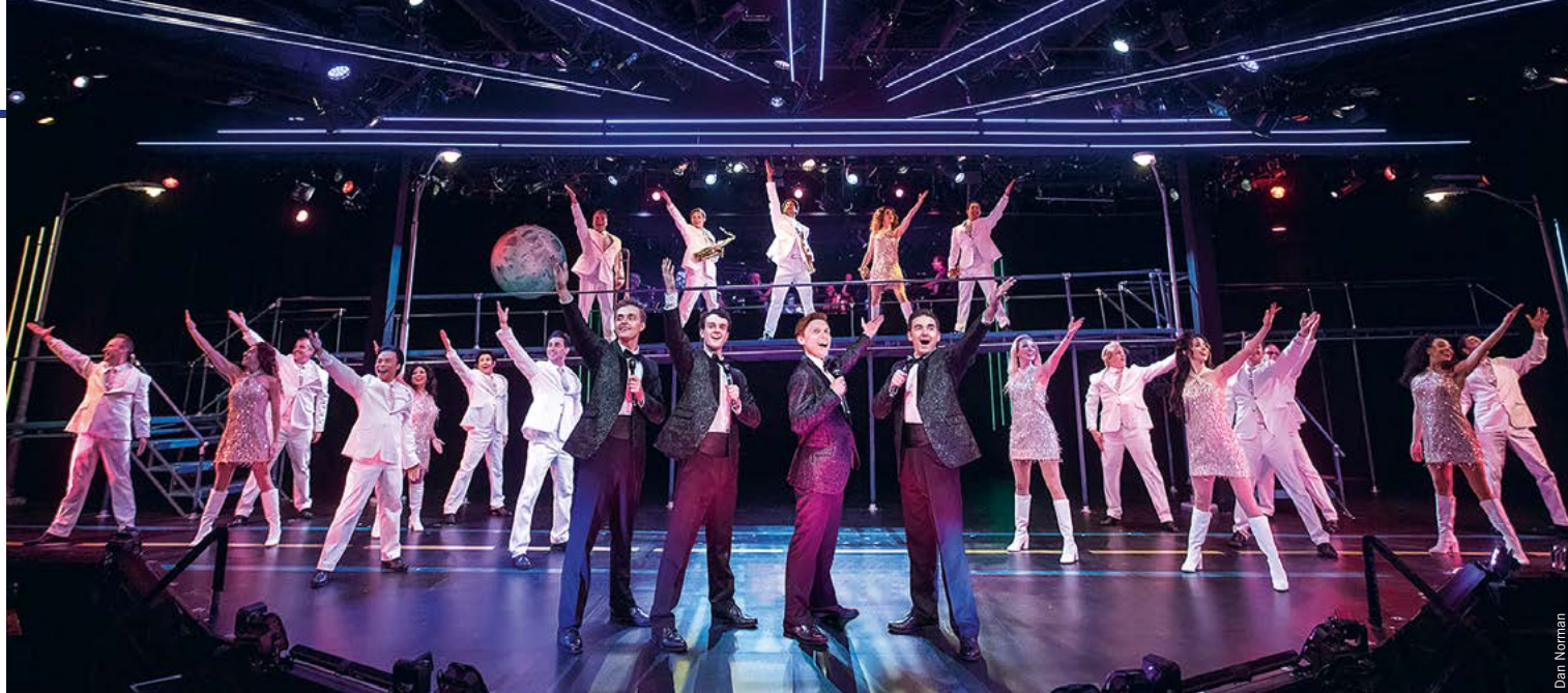
Een unieke ervaring is een avondje naar Chanhassen Dinner Theatres