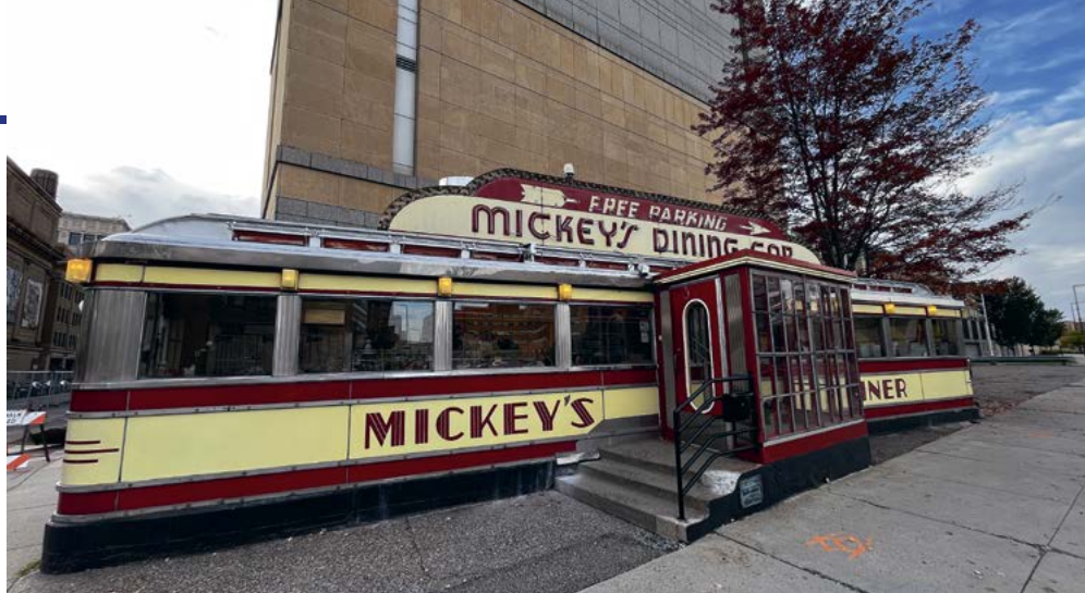
Mickey's is sinds covid alleen nog beschikbaar voor feestjes, maar blijft Juicy Lucy om naar te kijken

Bekende uitgaansgelegenheden in Saint Paul zijn het historische Palace Theatre dat na veertig jaar leeg te hebben gestaan in 2017 haar gerenoveerde deuren opende. De Turf Club is een ander icoon, net als het Minnesota Music Café en Wilebski's Blues Saloon. Er is zelfs een plek waar ze naast muziek Nederlandse friet serveren: de Amsterdam Bar and Hall. Verderop in Minneapolis, aan de oevers van de Mississippi, staat in Dinkytown sinds 1915 een van origine bioscoop die nu swingt als het Varsity Theater. Een andere voormalige bioscoop waar muzikanten anno 2024 de dienst uitmaken is Skyway Theatre & The Loft. Lady Gaga, John Mayer en The Black Keys stonden allemaal op het podium van het Fine Line Music Café in de North Loop's Warehouse District. En dan zijn er natuurlijk nog The Armory waar Prince de videoclip van 1999 opnam en dé poptempel van Minnesota en omstreken: First Avenue. De maestro zelf kijkt tegenwoordig als een ruim dertig meter hoge mural neer op de club waar hij kind aan huis was. En hij niet alleen. Op de Star Wall staan de namen van ontelbare sterren die hier hun plekje aan de hemel verdienden. Maar ondanks dat hij op 21 april 2016 nog geen half uur rijden van deze plek stierf, straalt de ster van Prince Rogers Nelson nog steeds het felst.