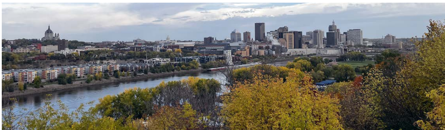
Uitzicht op de skyline van Saint Paul met de koepels van de kathedraal en het Capitool

Summit Avenue is meer dan zeven kilometer lang en eindigt aan de oevers van de Mississippi. Aan de overkant van de rivier ligt de andere helft van de twee-eiige tweeling; Minneapolis. En ook hier hebben de rijken in de loop der jaren hun stadsparadijsen geschapen. Onderweg op de tachtig kilometer lange stadsfietstocht The Grand Rounds Scenic Byway, fiets je behalve langs de Mississippi, het downtown waterfront en Minnehaha Falls, ook langs het Lake of the Isles. Zo mooi als de naam, zijn ook de huizen aan dit meer. Met pijn van het zadel en ook in het hart, nemen we na een paar dagen afscheid van de Twin Cities . " Hypnotizing, mesmerizing me. She was everything I dreamed she'd be ", klonk het in het Chanhassen Dinner Theatres toen het gordijn van ons bezoek opende. " All good things they say, never last. And love, it isn't love until it's past ", zingen we in de auto, als het doek na een paar schitterende dagen gevallen is. ⚡