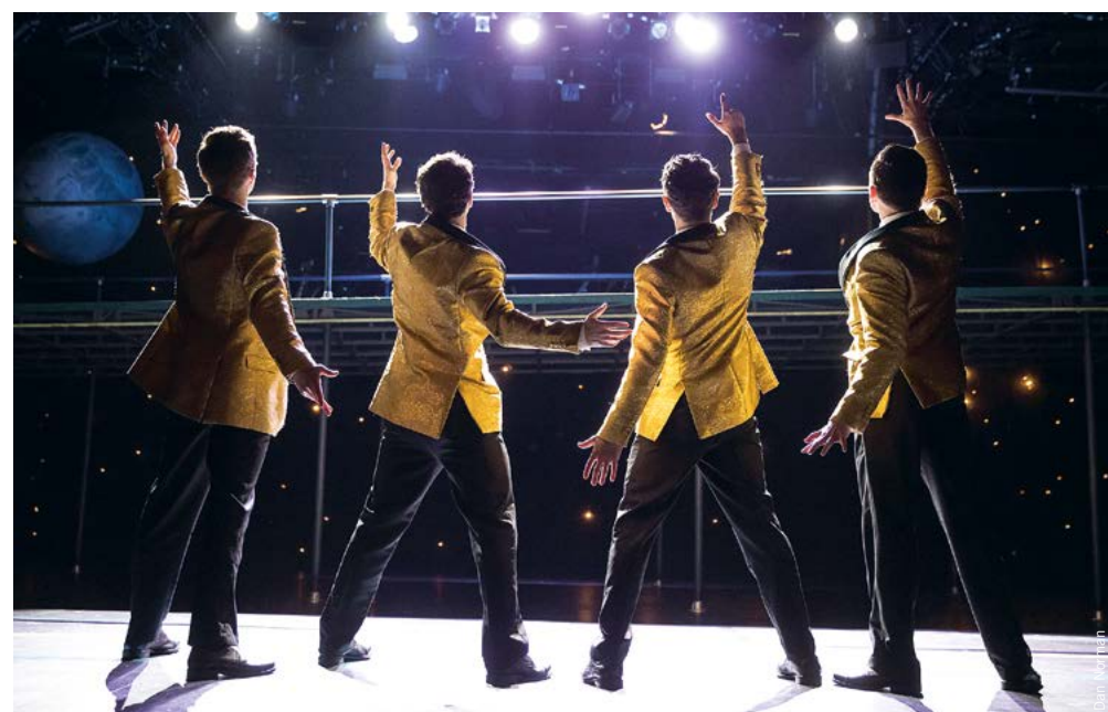
Eet, drink, kijk en luister