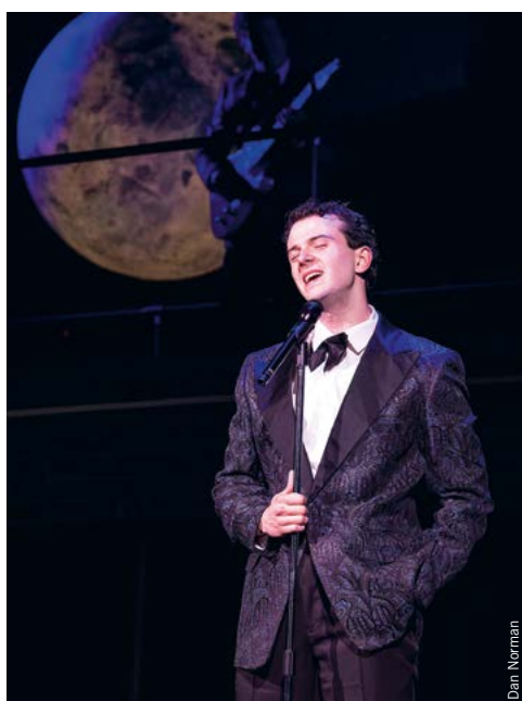
Zonder dat je het wist ken je alle hits van de Four Seasons