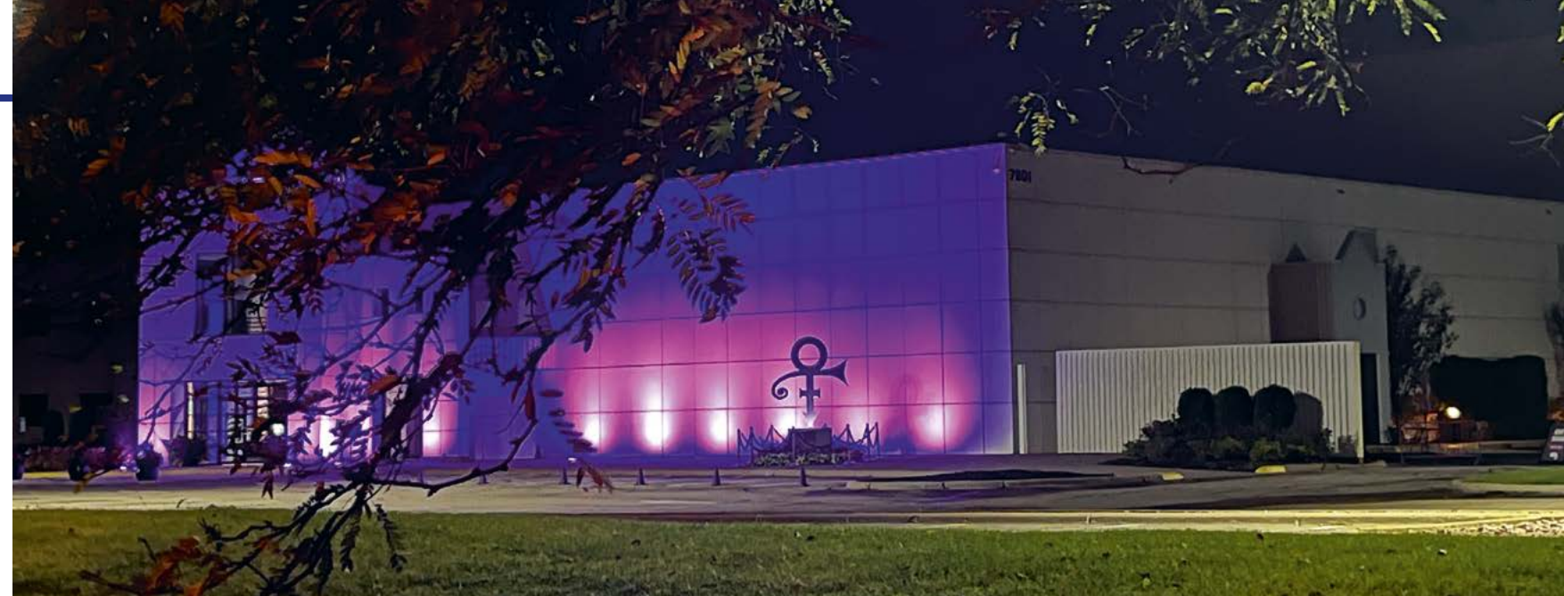
Paisley Park is een tempel die Prince bouwde voor (zijn) muziek