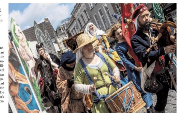
Een historische optocht is een van de blikvangers van Nassaudag.

• Voor het volledige programma: bredanassaudag.nl