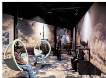
Liberation Garden is een gloednieuw belevingsmuseum in het Kamp van Beverlo in Leopoldsburg.

Op dinsdag 28 mei 1940 ondertekende koning Leopold III de capitulatie van België. Het was het begin van een vijf jaar durende bezetting onder nazibewind. Een periode die nog steeds wordt gedocumenteerd en vastgelegd, niet in het minst door voortreffelijke musea die tegelijk ook kenniscentra zijn.