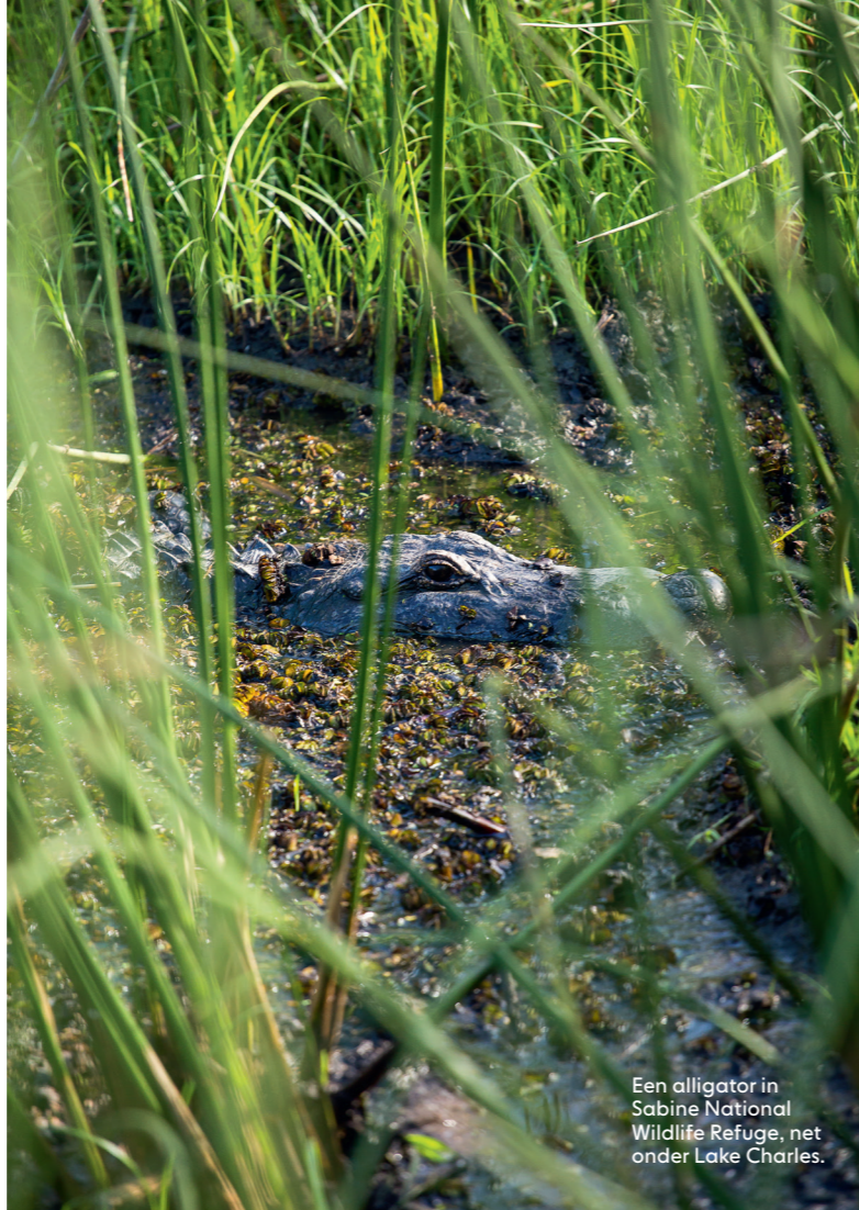
Een alligator in Sabine National Wildlife Refuge, net onder Lake Charles.