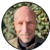
Tekst en fotografie Hans Avontuur

R oute 60 volgt de loop van de New River. Stroomopwaarts. De Harley-Davidson Road Glide beweegt soepel mee op het ritme van de bochten in de rivier. Terwijl de twee cilinders machtig stampen, klimt de weg geruisloos omhoog. Huizen en bedrijven maken plaats voor rotsen en vergezichten. Dan staat daar plotseling The Mystery Hole, zo'n typisch Amerikaanse roadside attraction uit de jaren zeventig.